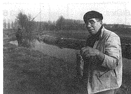
Ouverture de la pêche