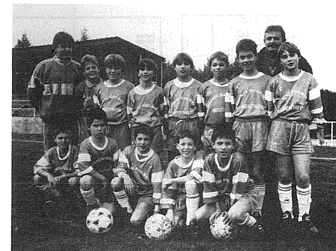
L'équipe Pupille qualifiée pour la finale en coupe du district.