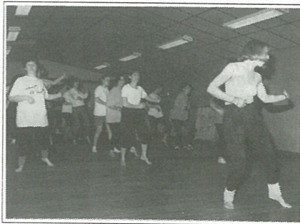
Stage de danse africaine

Pour les vacances de Pâques, un projet spectacle est programmé. Le programme sera accroché en début de semaine des vacances.