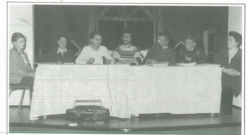
Rythmes scolaire : soirée Information

Le lendemain les participants et leurs parents seront accueillis à la salle polyvalente pour la remise des prix.