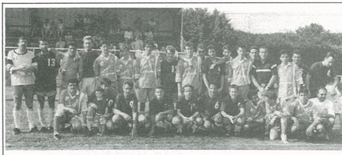
Journée de tous les sports.