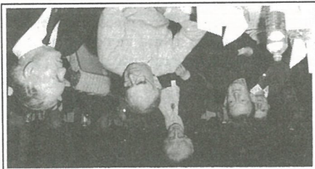
Repas des Aînés le 23 Janvier