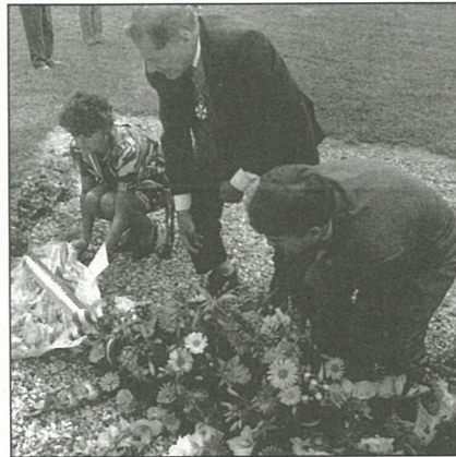
Commémoration du 24 août 44