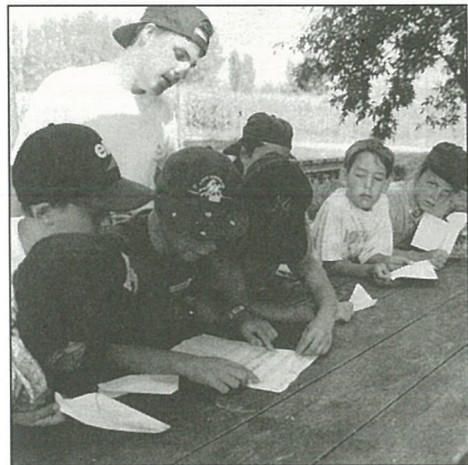
Centre de loisirs

Appel : la Bibliothèque est toujours prête à accepter les dons de livres ( en bon état ), que ce soit des livres pour enfants, pour adultes, ou des BD.