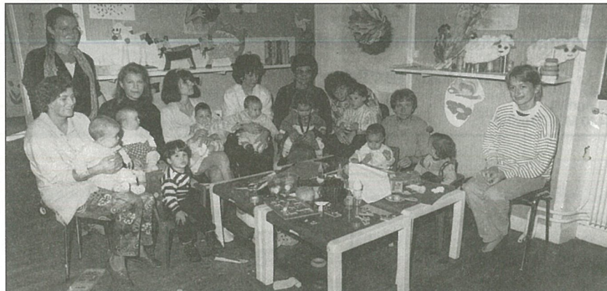
La rentrée des P'tits Loups