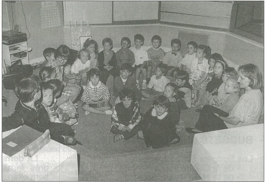
Rentrée à la maternelle