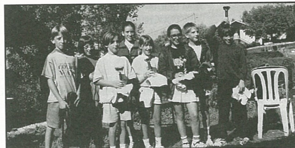
Finalistes et vainqueurs du TOP 16.

Pour les prochains tournois nous vous demandons de faire participer nos jeunes au maximum, le planning est affiché au tableau près des courts.