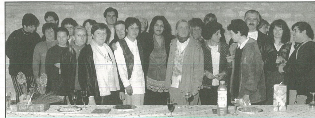
Fin de Stage au Centre de Formation.

Le Comité des Fêtes de Mouthiers présente ses vœux pour 1995, à l'ensemble des Monastériens.