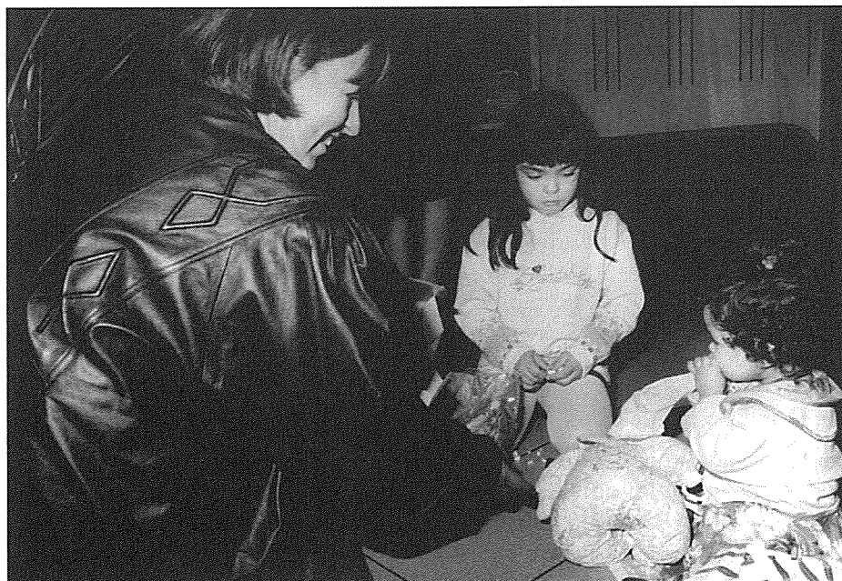
Noël des enfants des employés communaux.