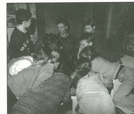
Au Centre de Loisirs