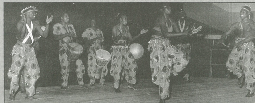
La Troupe des SAABA.

Vivement l'année prochaine, pour la poursuite de cette année scolaire qui sort déjà de l'ordinaire.