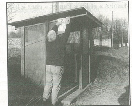
Affichage modification POS