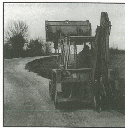
Travaux sur route du Rosier

C'est pourquoi le Conseil Municipal a, lors de sa réunion du 10 février adopté à l'unanimité, une motion de protestation contre cette décision gouvernementale autoritaire et pénalisante.