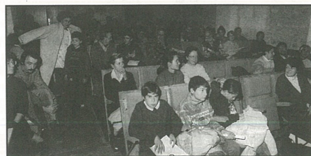
Conférence Charente Nature