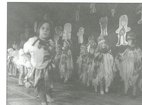
Fête de la Maternelle.

• HORS COMMUNE : 95 frs par jour et par enfant 85 Frs/jour/enfant à partir du 2 ème enfant