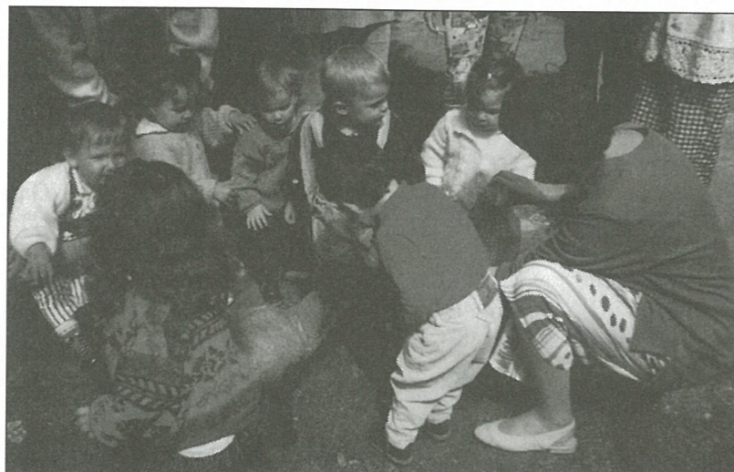
Crèche Familiale de Mouthiers.

Pendant ces mois de Mai et Juin, les 20 p'tits loups de la crèche familiale de Mouthiers ont eu un emploi du temps «chargé» :