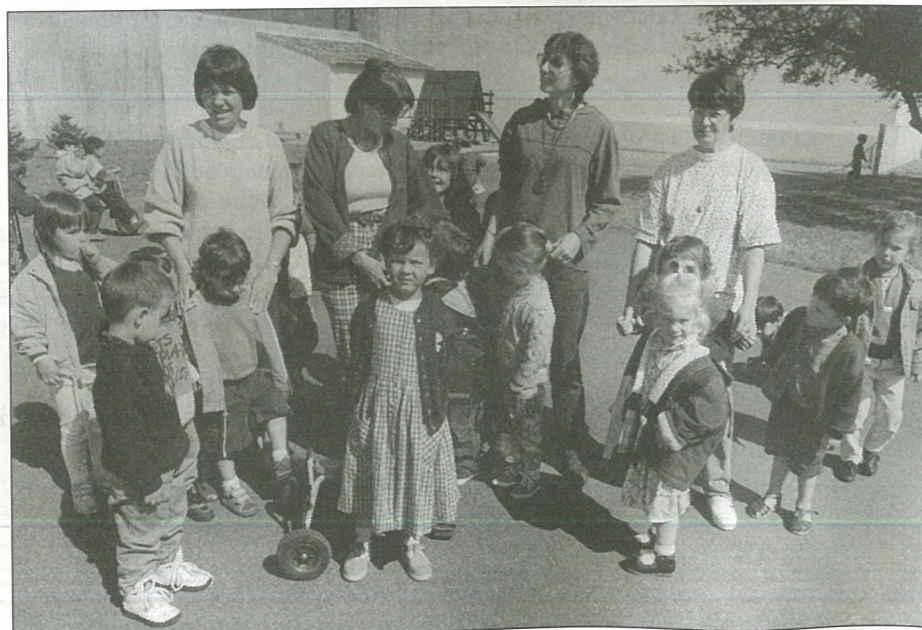
L'équipe maternelle au complet