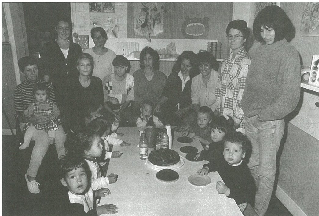
La crèche familiale