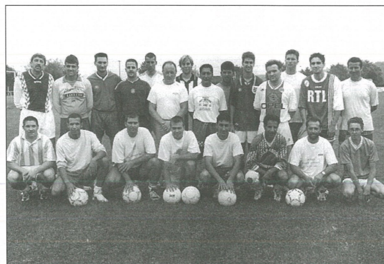
Reprise de l'entraînement

Toutes les informations concernant le Centre Social sont dans la plaquette qui sera distribuée dans toutes les boîtes aux lettres des 4 communes de la Communauté, début septembre.