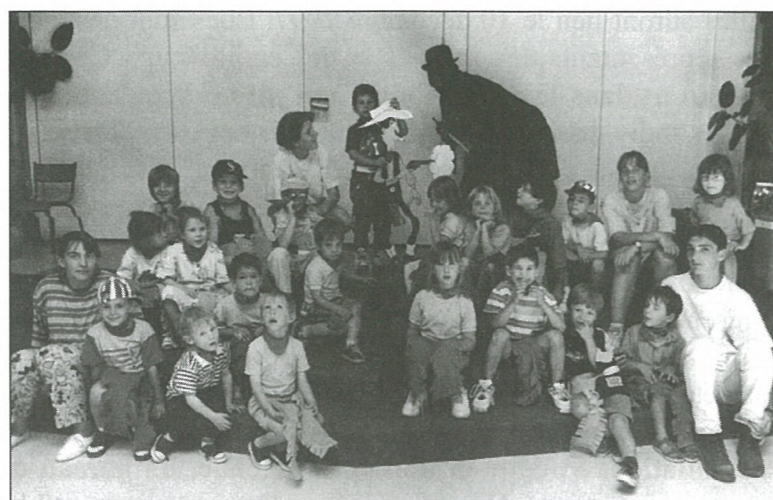
Centre de Loisirs Finies les vacances !