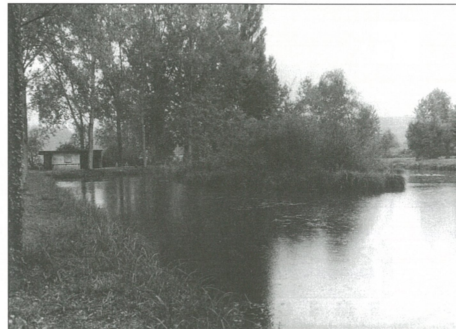
Les tourbières, un coin de fraîcheur

Chaque litige est, en principe, d'abord examiné par un bureau de conciliation. Si celle-ci n'est pas obtenue, un bureau de jugement examinera l'affaire. Une fois jugée, celle-ci sera susceptible d'appel.