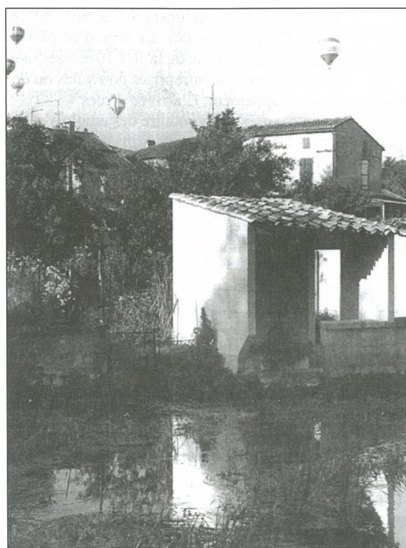
LAVOIRS : Certains les ont d'en haut, d'autres d'en bas (pour les 90 participants de la visite épicurienne du 7 août)