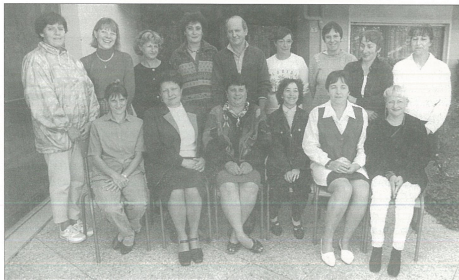
L'équipe du Foyer Résidence

Un résultat presque déjà acquis quant on sait que des enfants de résidents envisagent déjà leur installation dans l'établissement, quand l'âge sera venu. ■