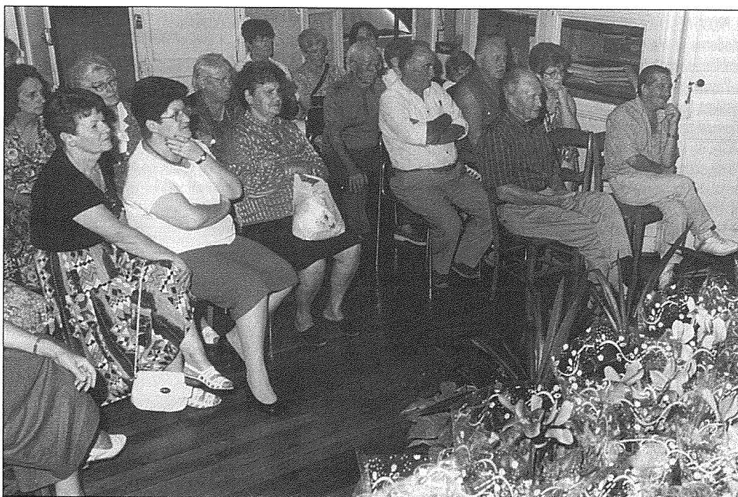
Palmarès des Maisons Fleuries : les fleurs méritaient bien un pot.