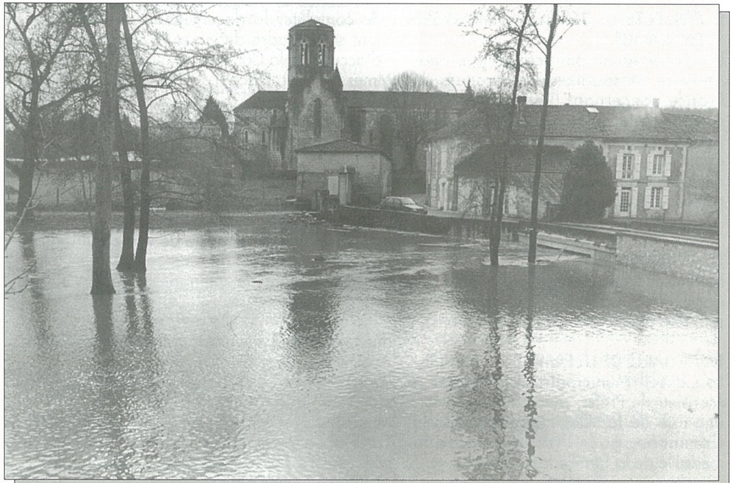
Quand la Boëme s'évade...

Impression : Composervices Angoulême RC 86 B 0280