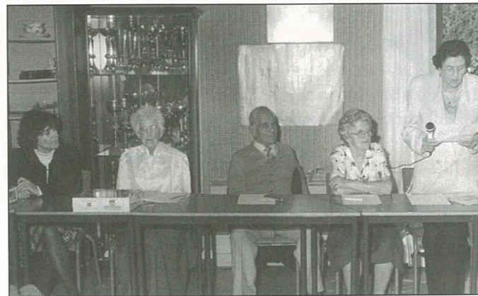
L'Assemblée Générale du Cercle des Aînés

Madame le Maire a la grande gentillesse de nous en offrir un exemplaire, ce dont nous la remercions infiniment. C'est elle aussi qui clôture cette 27 ème assemblée générale, par un petit mot aussi chaleureux qu'encourageant.