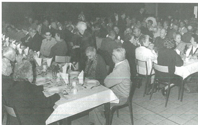
Repas des Aînés avec le Conseil Municipal