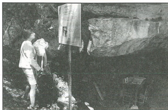
Inauguration panneau de la Chaire à Calvin