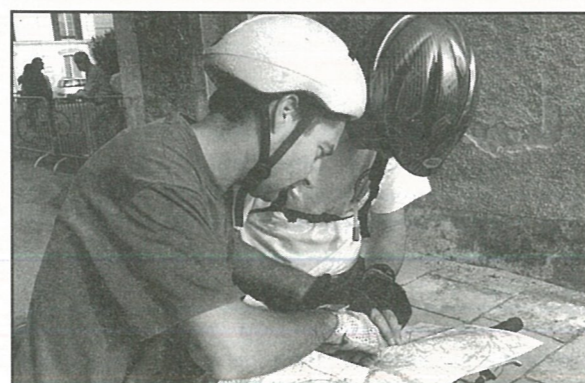
Course VTT Azimuth