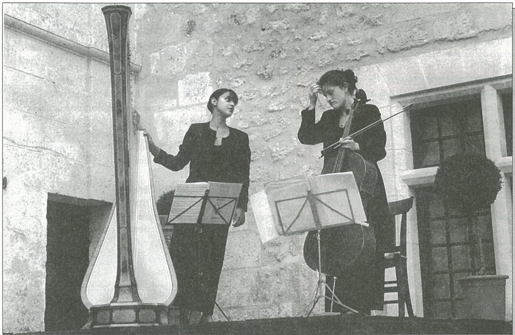
Concert à Forge

Impression : Composervices Angoulême RC 86 B 0280