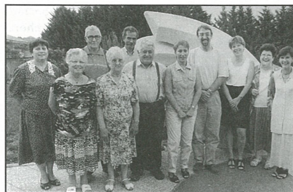
Nouveau Conseil d'Administration du Foyer