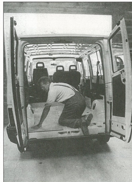
Nouveau bus

Le Conseil Municipal décide de s'associer aux parlementaires charentais afin de déposer une délibération auprès des conseillers techniques du premier Ministre pour l'aménagement des infrastructures routières de la Charente. (voir Parlons-en).