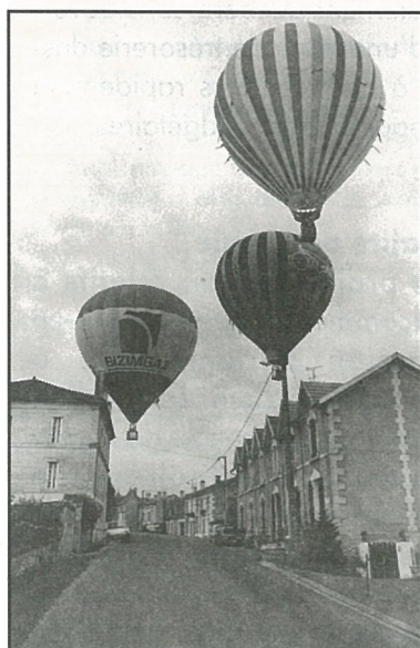
Montgolfières à La Rochandry