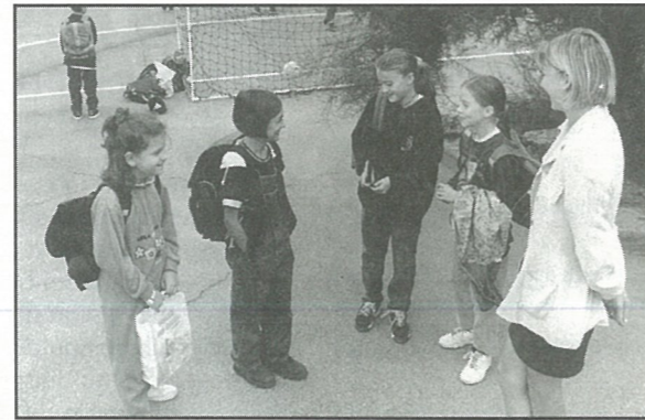
... les plus grands de l'école élémentaire ...