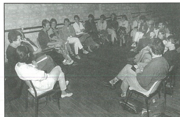
... pour les parents d'élèves ...