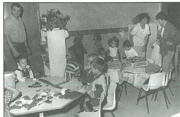
Rentrée pour les petits de la maternelle...

Le Conseil Municipal décide de reporter à l'année prochaine la renégociation d'un prêt auprès de la Caisse des Dépôts et Consignations, le temps imparti pour le préavis étant trop court.