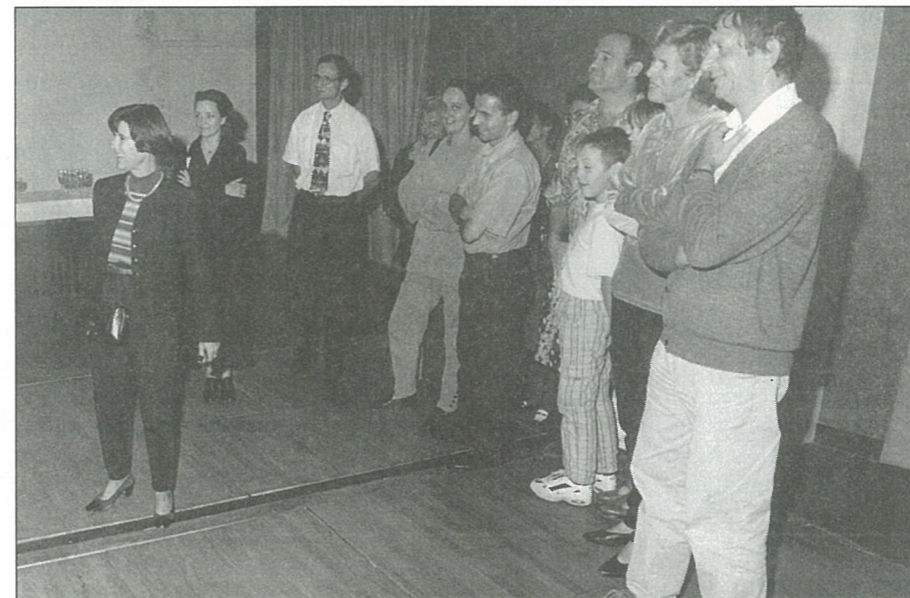
L'accueil des nouveaux habitants

Cela fait 10 ans sur chaque enveloppe qui part de Mouthiers se voit apposée une oblitération particulière. Cette flamme-annonce rectangulaire apposée dans la zone réservée à l'affranchissement comprend un dessin reprenant la frise de la Chaire à Calvin. Et pour que cela soit plus clair encore, le nom de ce site, ainsi que la présence des châteaux et des tourbières sont indiqués en toutes lettres sous le nom de notre commune. La réalisation de cette flamme fait l'objet d'une convention avec la Poste. Celle-ci prévoit un remboursement, par la commune, des frais occasionnés par la mise en oeuvre de cette prestation, soit 1823 F pour 2 ans. ■