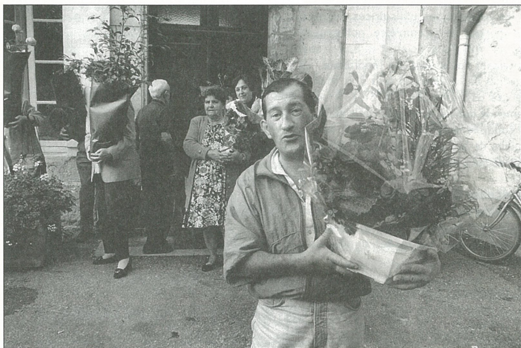
Les fleurs, après l'effort.