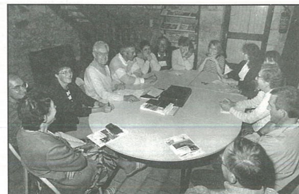
... et pour Sentiers de Boëme.