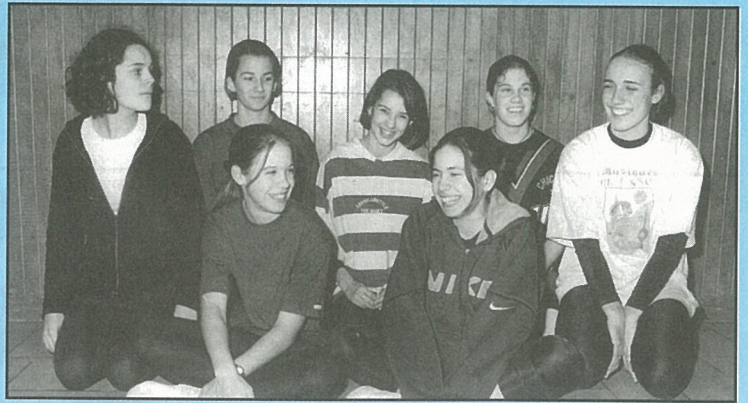
La gymnastique rythmique et sportive... donne la bonne humeur.