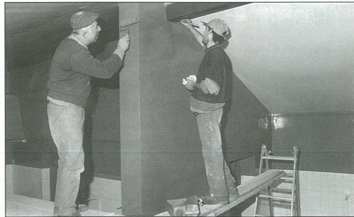
La cuisine de la salle polyvalente repeinte et pimpante