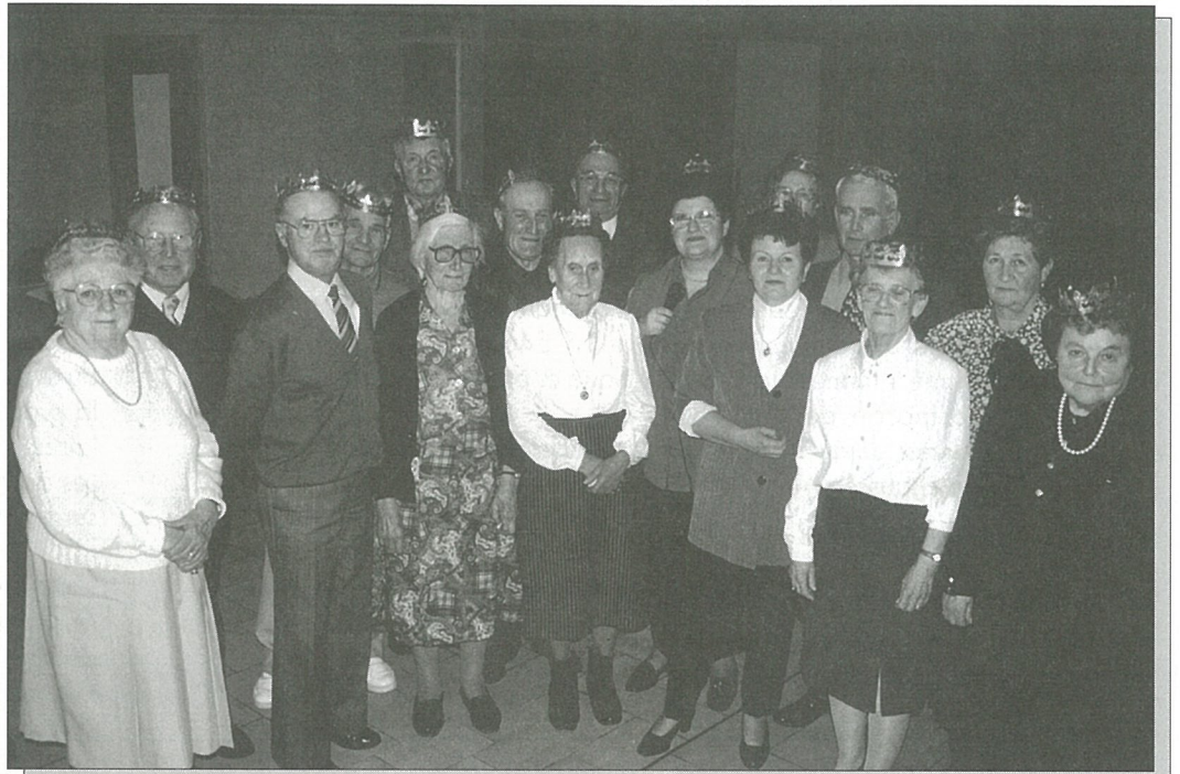
Un déjeuner de têtes couronnées

Impression : Composervices Angoulême RC 86 B 0280