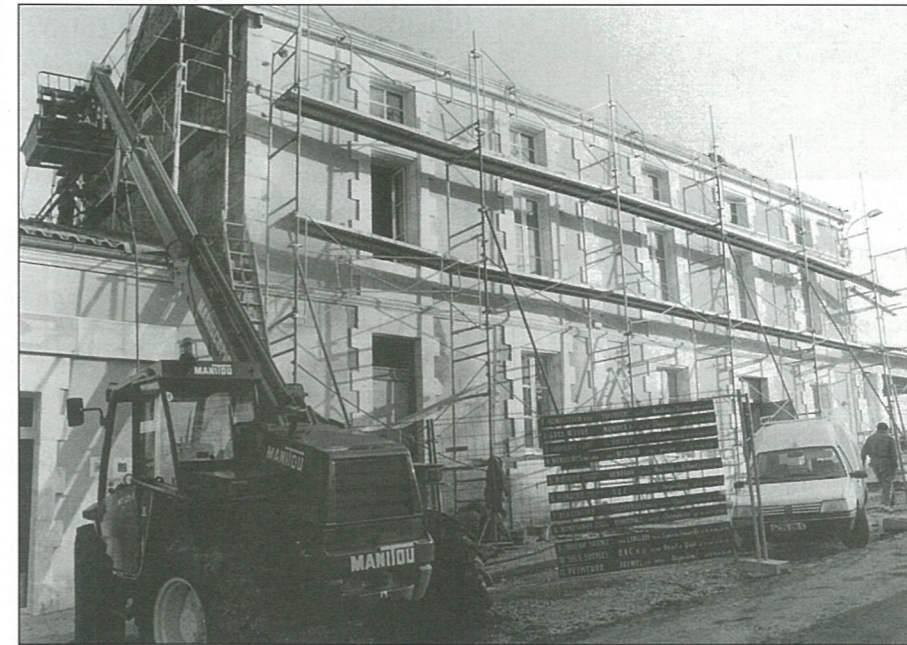
La future mairie a reçu sa toilette de printemps

Une circulaire de la Commission centrale des marchés prévoit qu'en cas de dépassement supérieur à 5% du prix proposé par une entreprise lors d'un appel d'offres public, un avenant doit être soumis à délibération de la collectivité publique. En l'occurrence les modifications proposées par l'architecte maître d'oeuvre concernent deux lots du chantier Mairie. Le lot n° 7 électricité avait fait l'objet d'un marché initial de 150 020,27F attribué à l'entreprise TELEPH'ELEC SERVICES. Or il s'avère que si les gaines avaient bien été prévues dans le cahier des charges, des câbles informatiques avaient été oubliés et ont dû être ajoutés. Sur le lot plâtrerie-cloisons sèches attribué à l'entreprise GENDRON Dominique pour un montant de 181 509,15 F TTC, l'avenant proposé est inférieur à 5 % (4 447,53 F TTC). ■