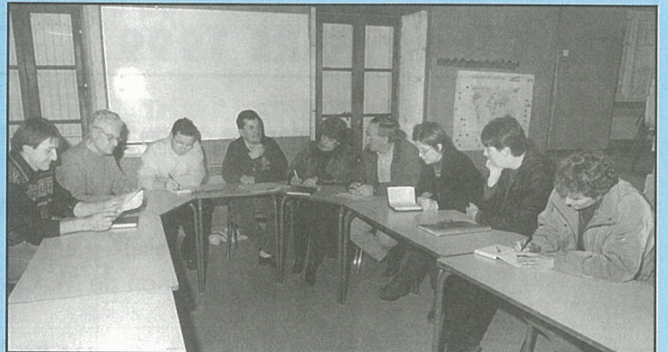
L'équipe du Carnaval fait le max pour les masques !