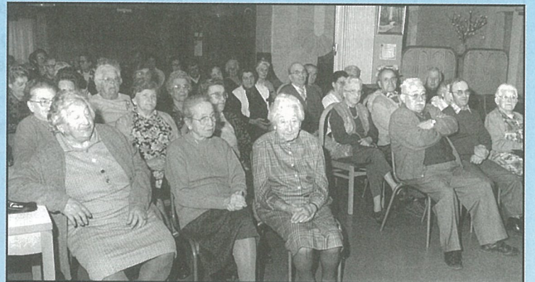
Assemblée Générale du Club des Aînés : le dynamisme n'a pas d'âge