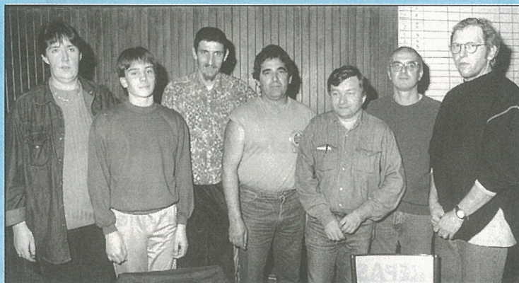
L'équipe du Comité des Fêtes pour le concours de belote