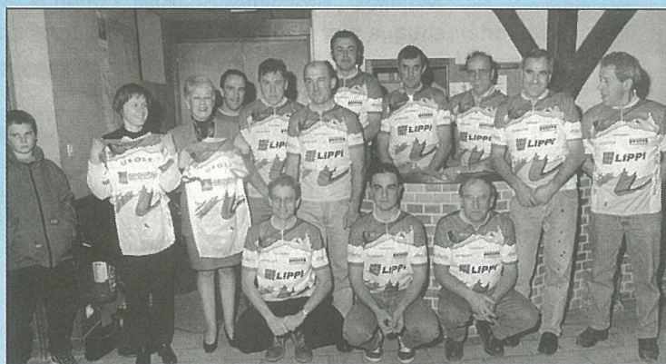
Les cyclistes ont un maillot à mouiller