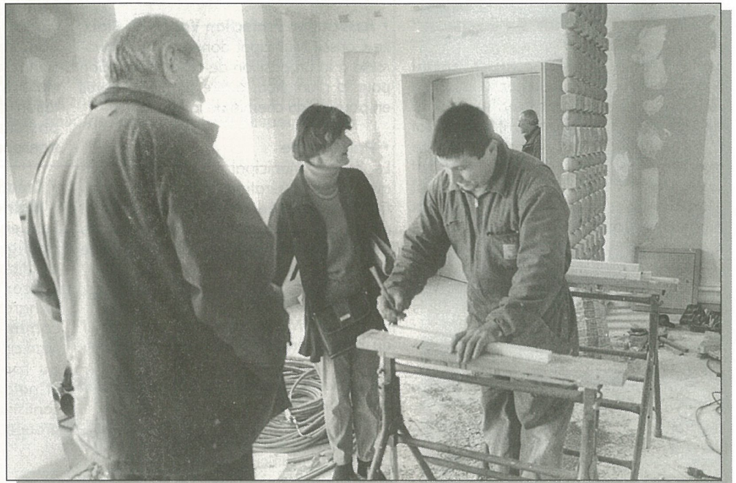
Mairie : le chantier s'accélère