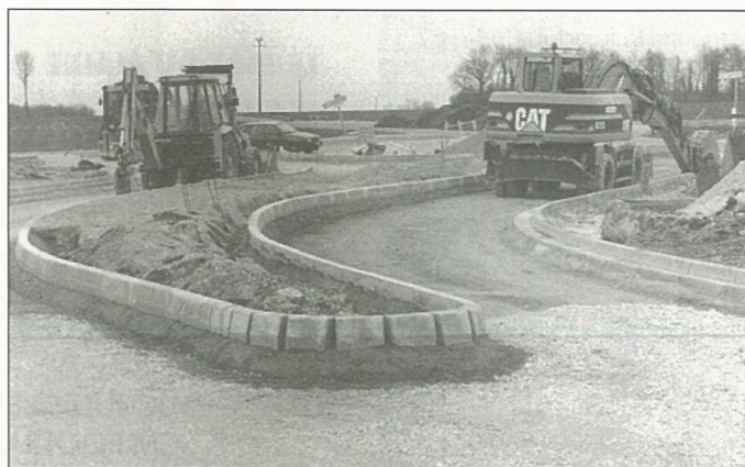
Rond-point du Peuplier Major ...

Les déclarants seront requis de signer leurs déclarations, lesquelles seront consignées au registre d'enquête.