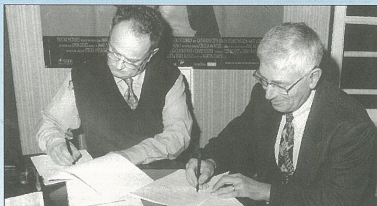
Signature convention ANPE-Centre Social