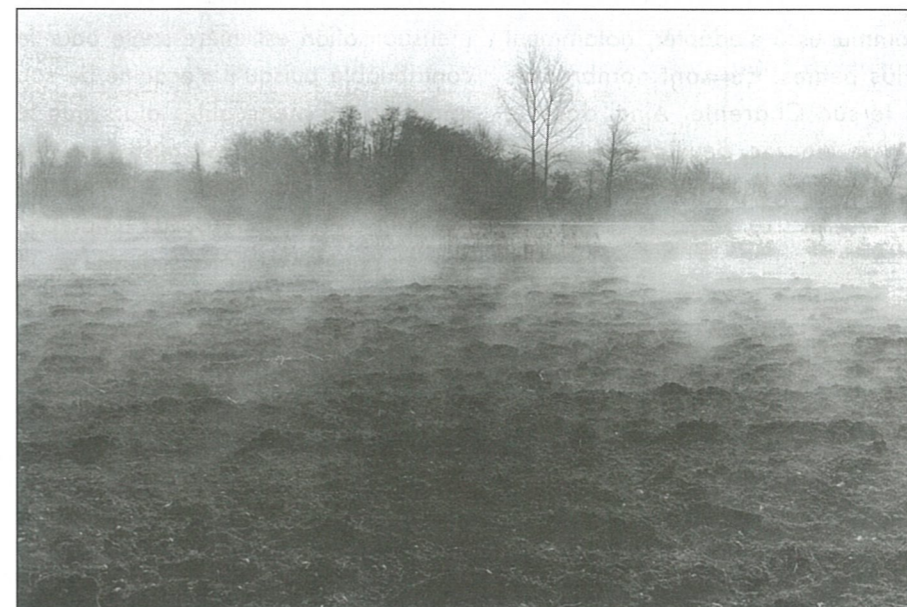
Paysages de brume

Le Conseil Municipal a décidé de vendre le bâtiment de la mairie actuelle. Le service des domaines, qui dépend du Ministère du budget a donc évalué ce bâtiment en fonction de son état général et des transactions ayant eu lieu dans le secteur géographique ces dernières années. Cette valeur a été arrêtée à 480 000 F plus ou moins 10 %. C'est pourquoi un accord a été trouvé avec l'acheteur sur la base de 450 000 F, les frais de la transaction s'ajoutant à ce montant. Il se trouve que ce bâtiment avait été acheté, puis aménagé, pour un total de 355 764,66 F. Comme il n'existe pas de réévaluation en fonction de l'évolution d'un indice (INSEE par exemple), ce montant s'exprime en francs de l'époque et non pas en francs 1999. C'est pourquoi, entre le prix de vente et la valeur comptable archivée dans les documents de la trésorerie, un écart équivalant à une plus value de 94 235, 34 F a été comptabilisé dans le budget 1999. ■