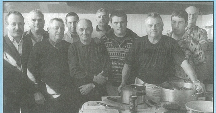
Société de chasse : repas anniversaire