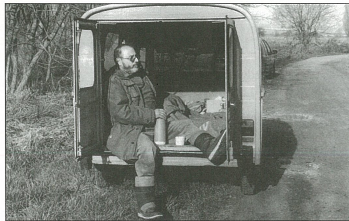
Ouverture de la pêche. Cherchez la rivière !

La Maire bientôt dans ses meubles, et réciproquement. Après consultation de nombreux fournisseurs, le conseil décide que la table et les fauteuils de la salle de conseil ainsi que les fauteuils des mariés dans la salle des mariages et un meuble pour le cadastre, soient fournis par la Société Bureau Désign. Le reste du mobilier des bureaux sera commandé à la société Evelyne DEUIL.