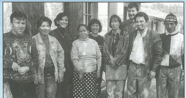
L'ASPAL accueille des latino-américains