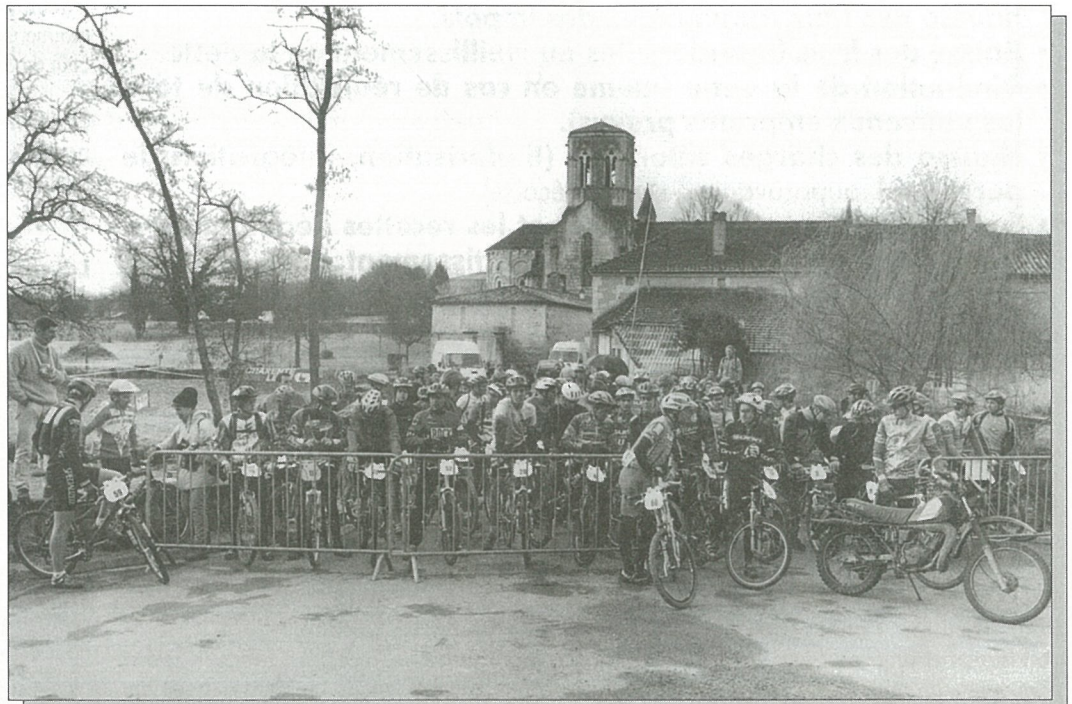
10 ème Boucle de la Boëme : Départ course en ligne