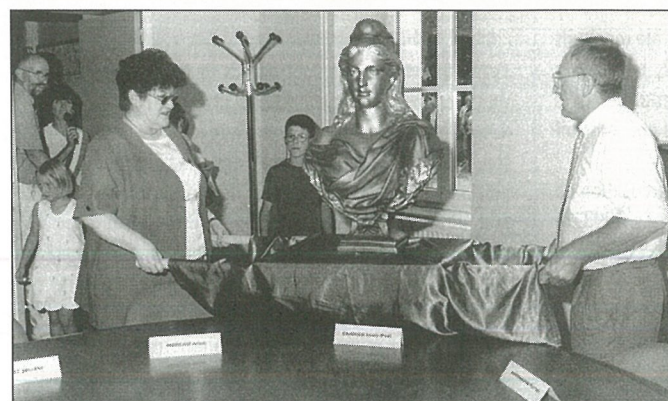
Marianne enfin dans ses murs...