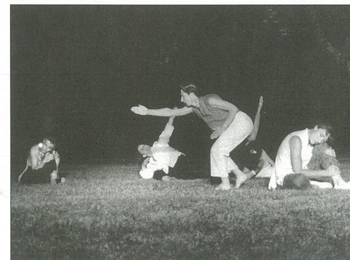
Pas laid... le ballet... nocturne !

Les autres éléments de mobiliers ont été attribués à la Caisse des Ecoles, au Centre Communal d'Action Sociale ou au Secours populaire (7 chaises).