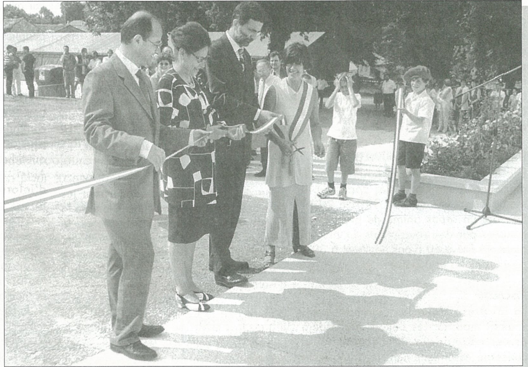
Sénateur, Préfète, Député, Maire, le ruban va se faire tout petit !

Impression : Composervices Angoulême RC 86 B 0280