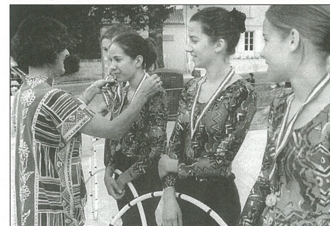
Les jeunes gymnastes championnes honorées par la commune.

L'aménagement du rond-point du peuplier major a reçu le label année du Patrimoine remis par le Conseil Régional. Une subvention de 15 900 F accompagne cette labellisation. Celle-ci atteste de la valorisation communale du patrimoine local, en l'occurrence de la Chaire à Calvin. Le projet a été primé pour avoir également mis en valeur une tradition régionale de créativité en matière de sculpture. Rappelons que ce projet a permis à des élèves de Mouthiers de travailler sur les thèmes de la préhistoire, du cheval à travers les âges. Il leur a également permis de s'intéresser de près à la taille de pierre et aux arts plastiques.