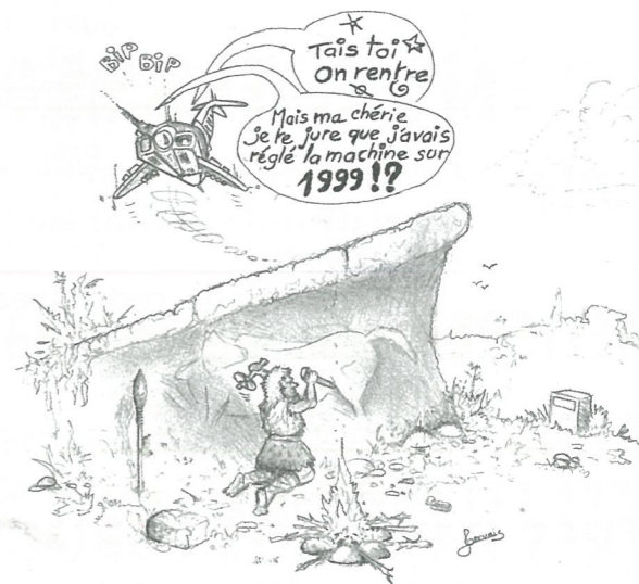
Illustrations Bernard GERVAIS

Ne serait-ce que pour donner du sens à l'expression " comptes-rendus " . A vous maintenant, de vous en rendre compte.