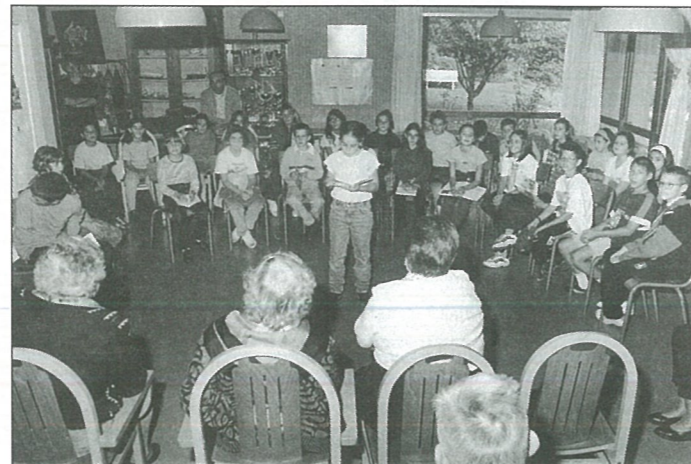
A livres ouverts entre les aînés et la classe de M. Carrier