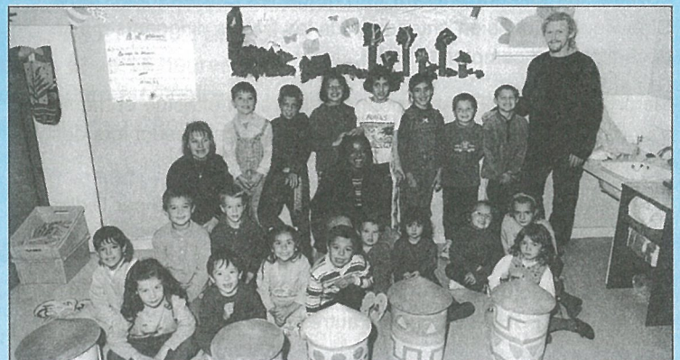
Sourires du Centre de Loisirs.