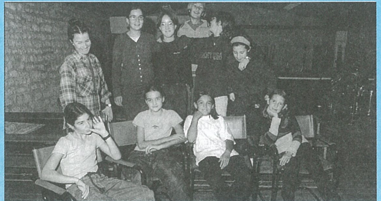
Sur les planches du Théâtre des enfants de la MJC.