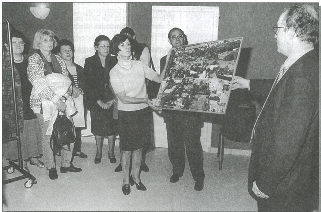
«Ciel, mon Mouthiers»

Mise en page et impression : Composervices Angoulême RC 86 B 0280