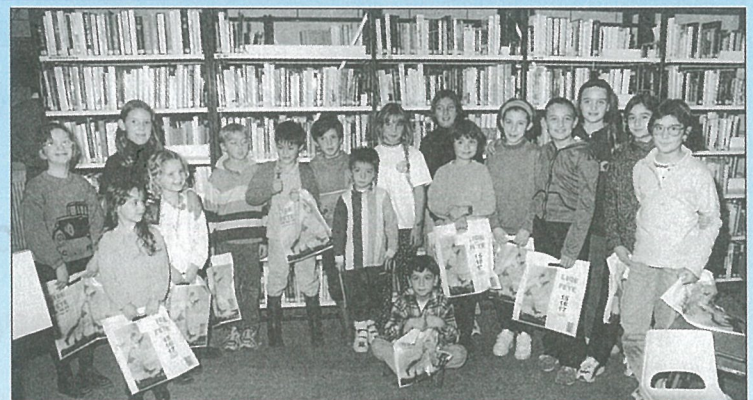
Lauréats de la «Fureur de Lire» 99.