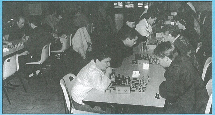
La réussite des échecs...