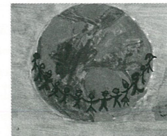
Dessin Lisa BLANCHARD

Nous voyageons pendant deux jours et, enfin, apparaissent les portes de la ville. Mais la neige n'est pas tombée ici. Sur la grand-place, tout le monde s'affaire pour installer bétail et marchandises. Les parfums d'épices et de fleurs alourdissent l'air. Certains pressent des oranges ou préparent le thé à la menthe. Sur des étalages brillent de magnifiques amendes, des figes mûres, des dattes et des citrons. Les ânes khôl et beige transportent des tapis-