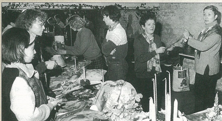
La peinture ça va de soie !