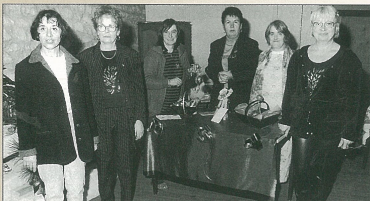
Les travaux des ateliers sociaux s'exposent