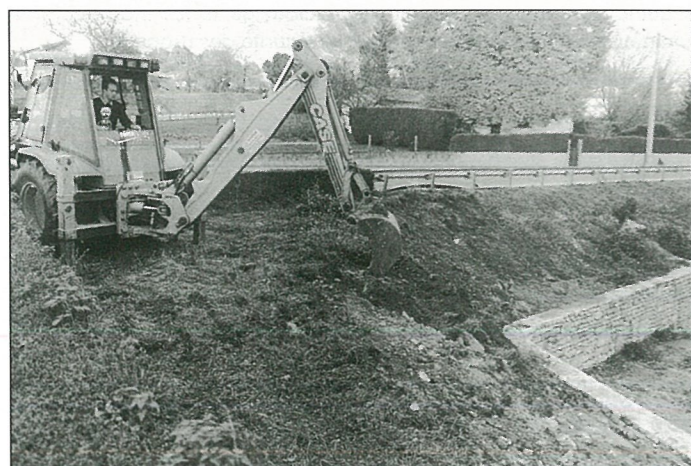
Avec les travaux d'hiver, le tennis ne sera pas pris de court.

Non vraiment, se faire enguirlander de cette manière-là, on en redemande...!