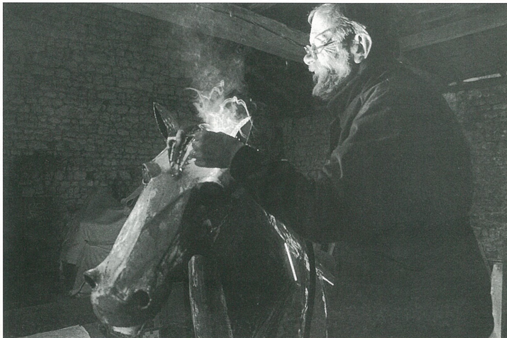
Le sculpteur fait avancer ses chevaux à la baguette... de soudure

Mise en page et impression : Composerservices Angoulême RC 86 B 0280