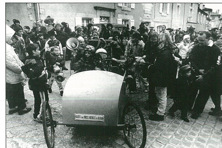
Carnaval à pédales et dans ses petits papiers...