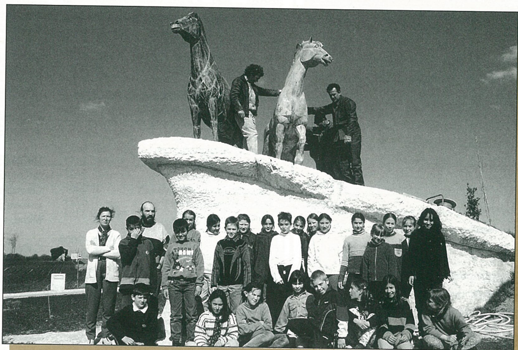
Si une alouette ne fait pas le printemps, trois chevaux l'ont fait à Mouthiers, grâce à l'équipe technique, sous l'œil des écoliers.

BULLETIN d'Information Locale édité sous la responsabilité du Conseil Municipal de Mouthiers sur Boëme