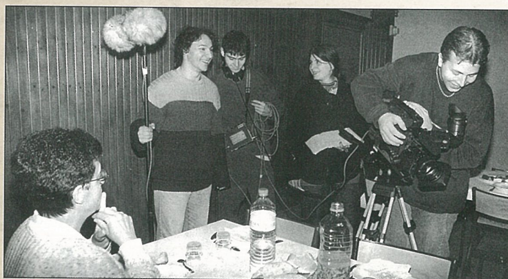
Les donneurs de sang devant les caméras : «une production sang pour sang charentaise.