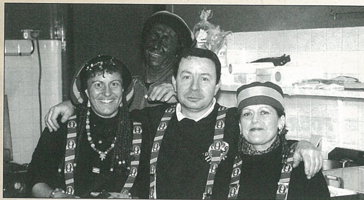
Carnaval : ambiance gaie, bénévoles reggae.