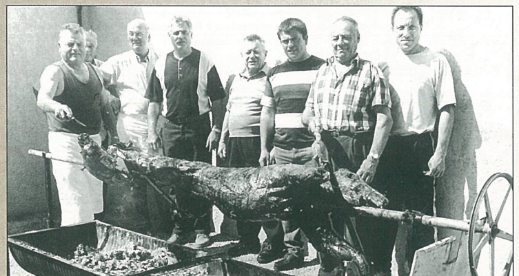
Une brochette de chasseurs et un sanglier à la broche...

Week-end classique : garde de 12h le samedi à 7h le lundi matin. Jour férié de semaine : garde de 18h la veille au lendemain 7h. Deux jours de suite : le changement de garde s'effectue à minuit.