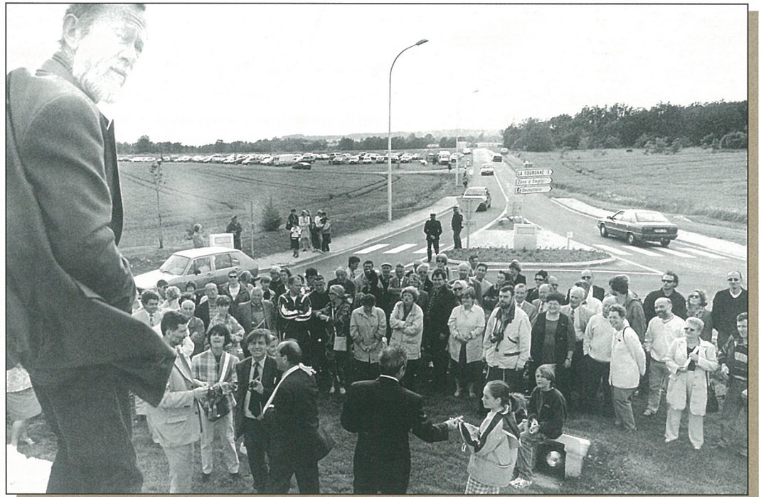
«Du haut de ce rond-point, 150 siècles vous contemplant» (Photo Eliane PORTE).

BULLETIN d'Information Locale édité sous la responsabilité du Conseil Municipal de Mouthiers sur Boëme