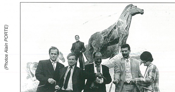
Une guirlande "d'officiels" pour couper le ruban du rond point.