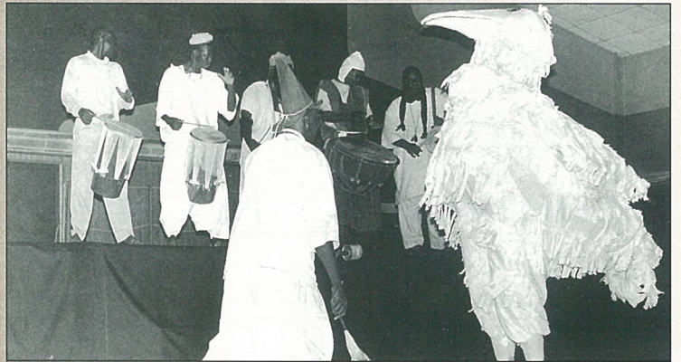
La salle polyvalente était noire de monde, pour le spectacle des Bambaras.