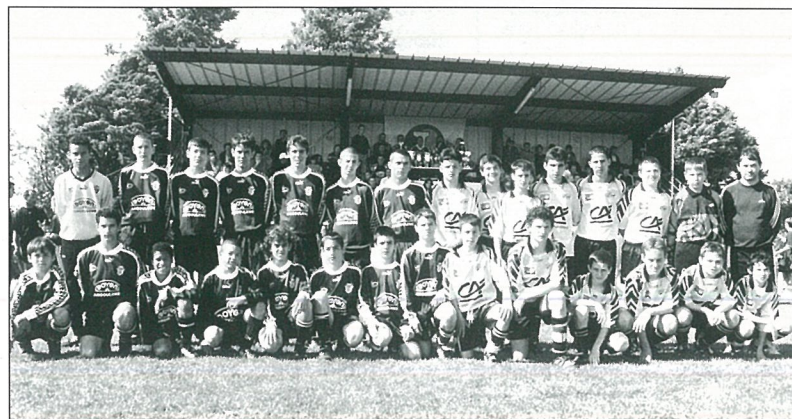
Le tournoi des moins de 13 ans.