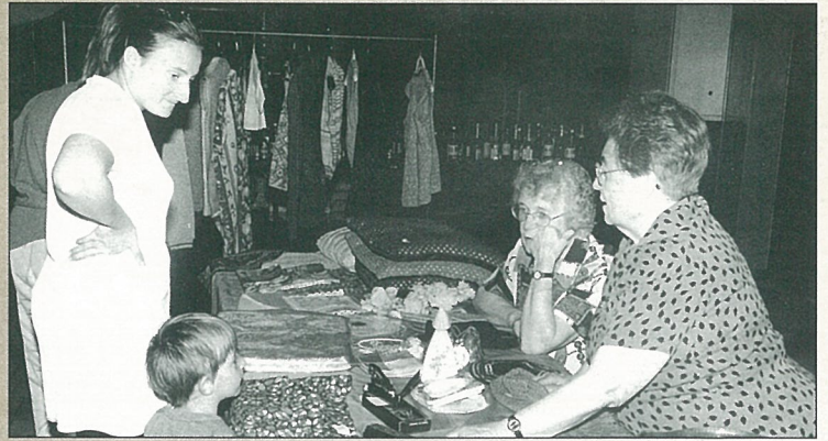
Les aînés font dans la dentelle.