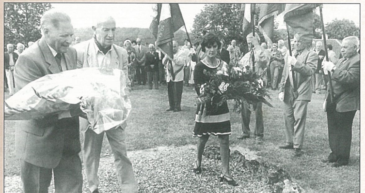
Hommage à la résistance.