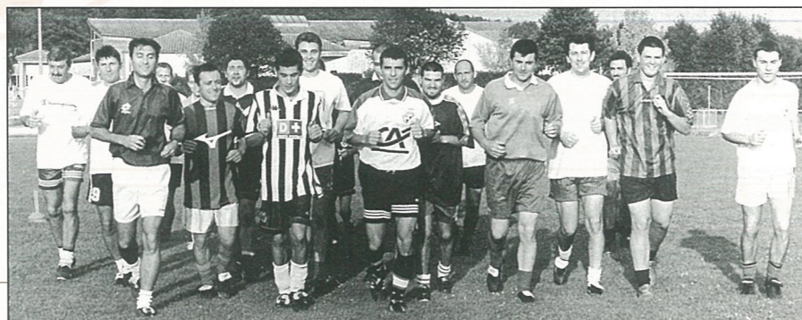
L'entraînement a repris pour les grands.