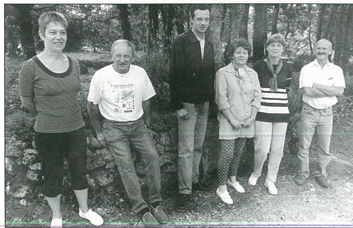
Le Jury des Maisons Fleuries, avant d'aller prendre un pôt... de fleurs ?