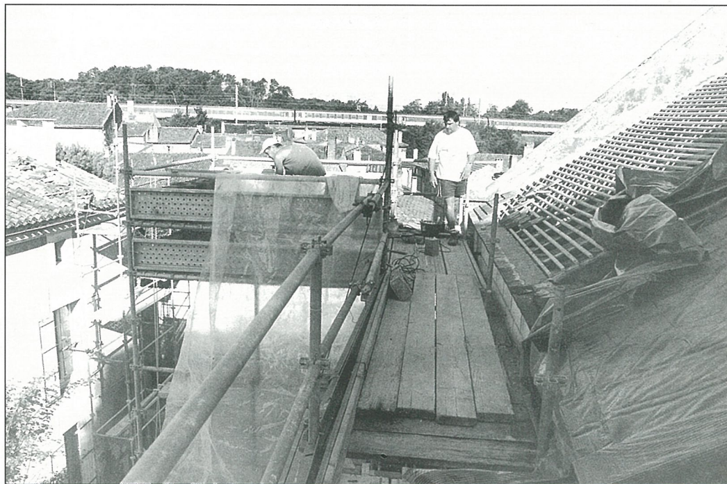
«La tempête fut une tuile ! Après les réparations, viendra l'ardoise...».

BULLETIN d'Information Locale édité sous la responsabilité du Conseil Municipal de Mouthiers sur Boëme