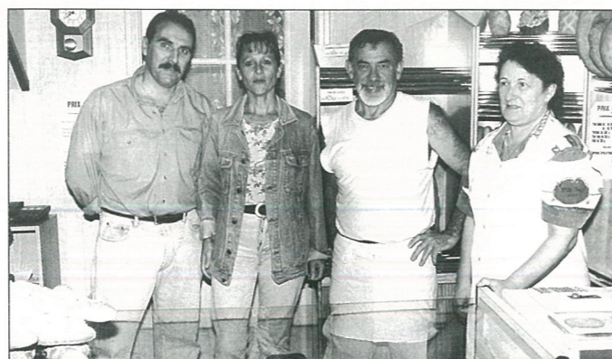
... et de nouveaux boulangers au four.