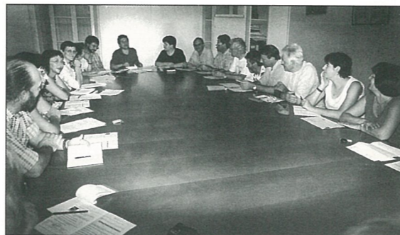
...la préparation de la fête des vendanges.