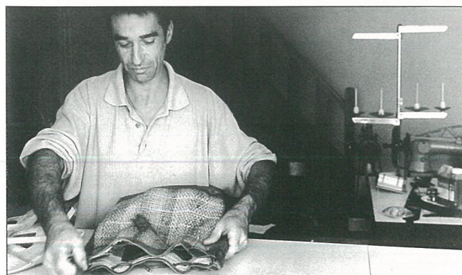
Un cordonnier pour cuir...