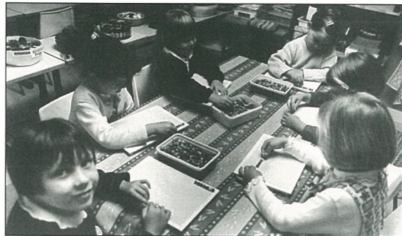
Après la rentrée des classes...