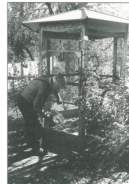
Gaëtan aux oiseaux.