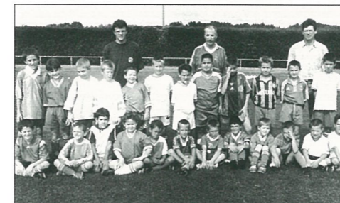
L'école de foot.

Réservation à retourner à : J.ESCANDE - grand guillon - 16440 Mouthiers P.DESVAGES la croix ronde - 16440 Mouthiers