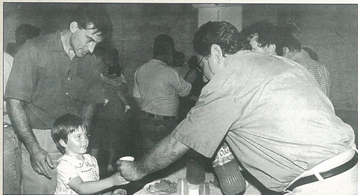
Bienvenue aux nouveaux habitants.