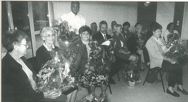
Propos fleuris pour les jardiniers lauréats.