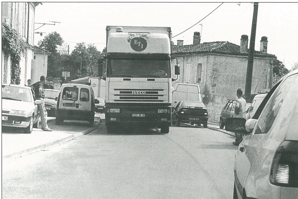
«Ils ont poussé le bouchon jusqu'à Mouthiers..!» (Photo Alain PORTE).

BULLETIN d'Information Locale édité sous la responsabilité du Conseil Municipal de Mouthiers sur Boëme