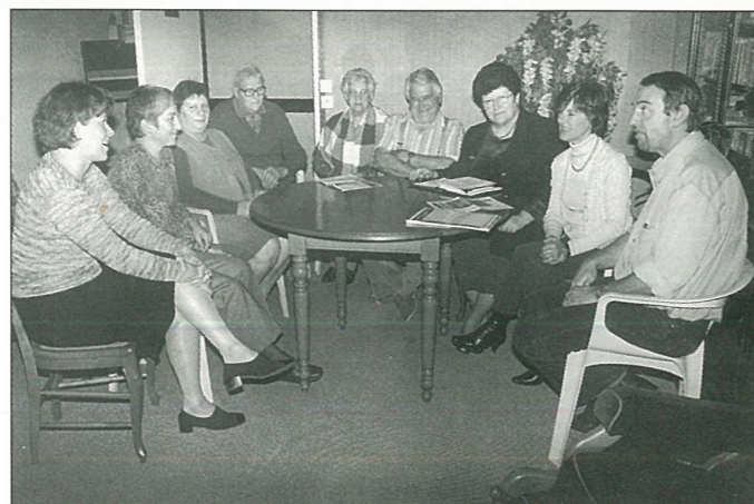
«...d'établissement du foyer logement».