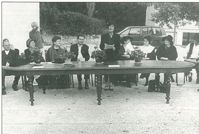
«...municipal du siècle» (Photo Alain PORTE).