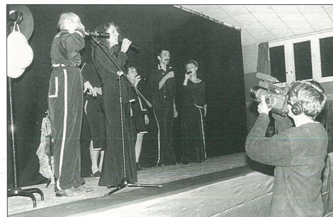
«ZigZag devant la caméra de France 2»