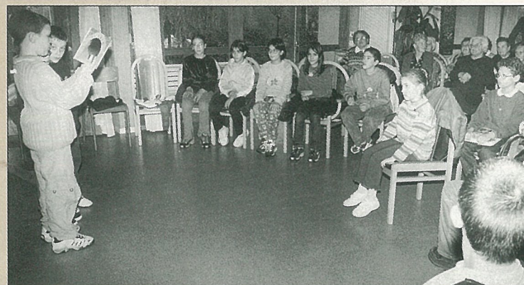
Jeunes et vieux toujours à la page pour Lecture en fête.