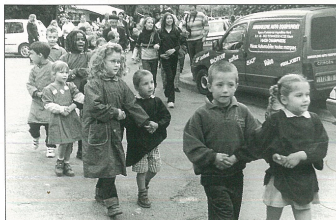
«Comme dans une cours d'école ancienne, rondement animée»

15 enfants de CM2 ont participé. La moyenne des fautes, sur les 62 premiers mots (actuellement, les dictées sont de 60 à 65 mots), se monte à 10 fautes. Mais les meilleurs n'ont totalisé que 4 et 5 fautes en tout. Et ils sont tous à féliciter !