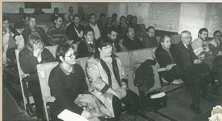
Réflexion sur l'éducation populaire et le rôle des associations.

Deux jours de suite : le changement de garde s'effectue à minuit.