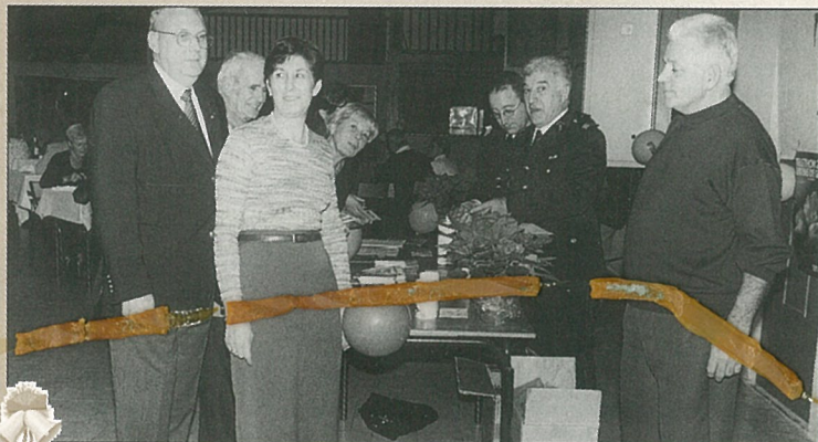
Soirée des donateurs, sang pour sang réussie..!

C'est à compter du 12 mars 1894 qu'elle a pris le nom de MOUTHIERS-SUR-BOËME.