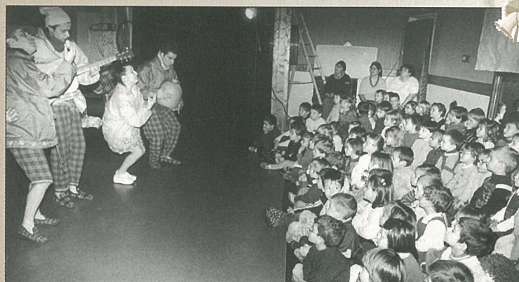
Spectacle à la maternelle.