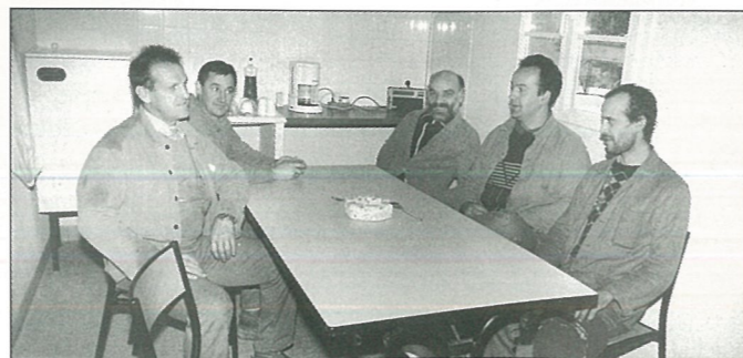
Une salle de repos méritée pour l'équipe technique.