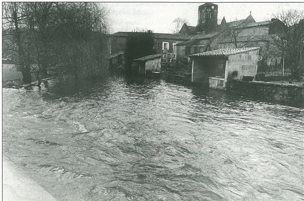
« Dans la vie, il y a des eaux et des bas... mais pour le bas, il faudra attendre. » (Photo Alain PORTE).

BULLETIN d'Information Locale édité sous la responsabilité du Conseil Municipal de Mouthiers sur Boème