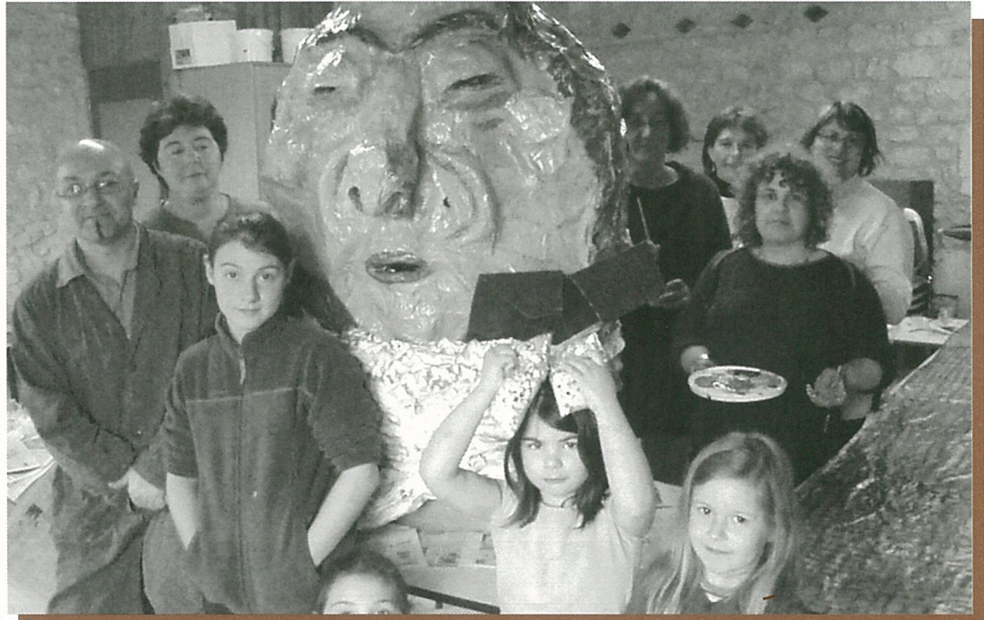
Personne n'a cru Monsieur CARNAVAL. Alors ils l'ont cuit..