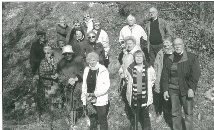
Ca marche pour Boème patrimoine!