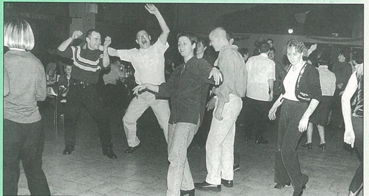
Un sacré zouk lors de la soirée antillaise du Comité des Fêtes.