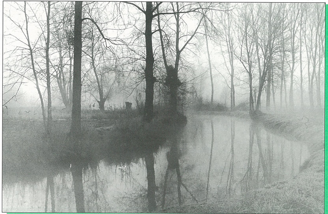
«La Boème pour ceux qui se lèvent avant les brumes.» (Photo Alain PORTE).

d'Information Locale édité sous la responsabilité du Conseil Municipal de Mouthiers sur Boème