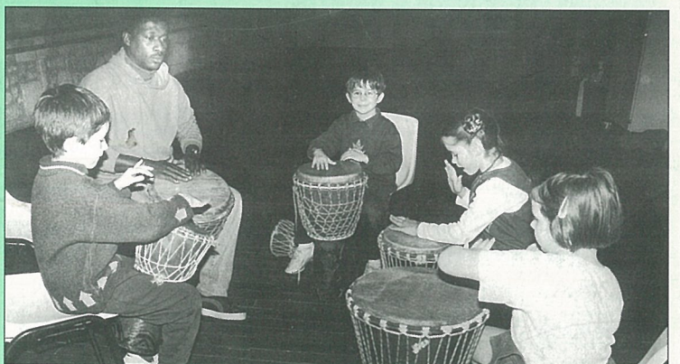
Le rythme dans la peau... de chèvre des djembés.