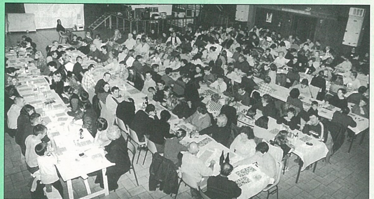
Loto du foot : l'affluence derrière les grilles.

Mme Anne-Marie MARTIGNAC © 05 45 67 84 88