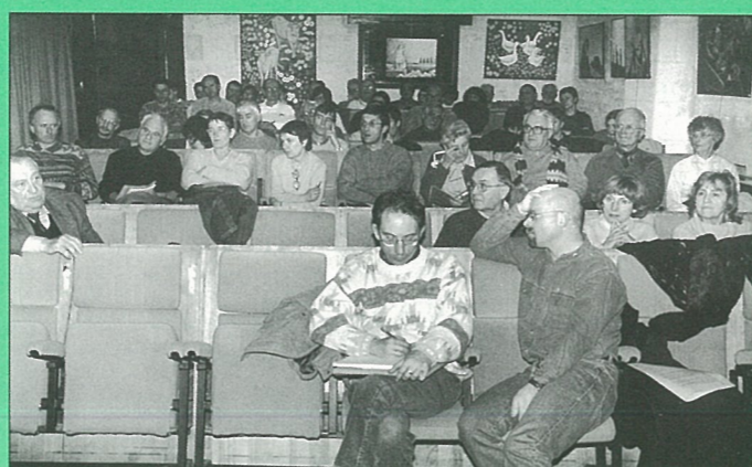
Soirée de l'Association ATTAC.