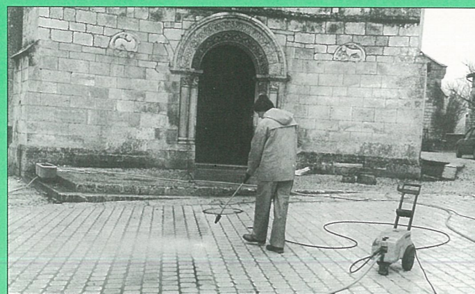
Place nette devant l'église.