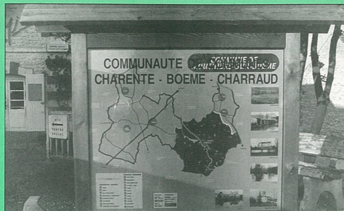
La Communauté de Communes s'affiche.