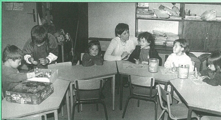
Le nouveau matériel du centre de loisirs est à la hauteur.