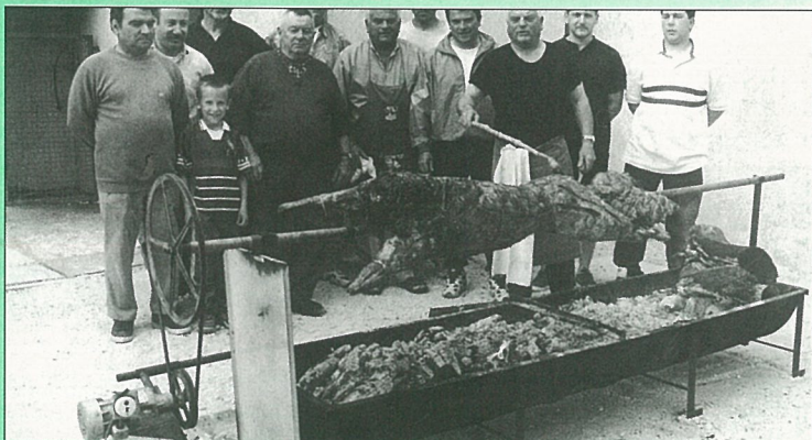
Le sanglier et les chasseurs.