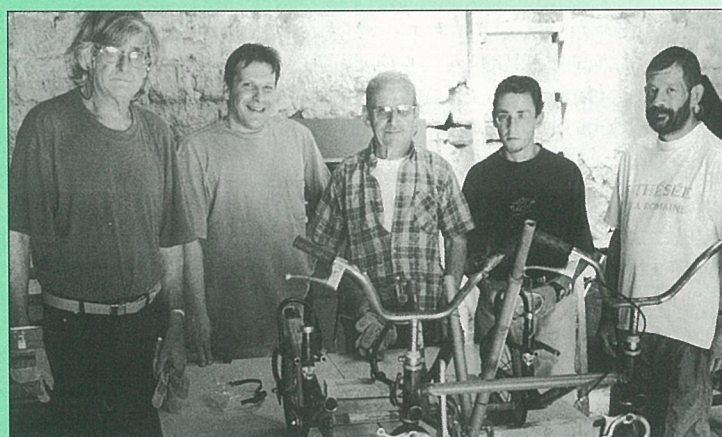
L'atelier d'insertion : une affaire qui roule !