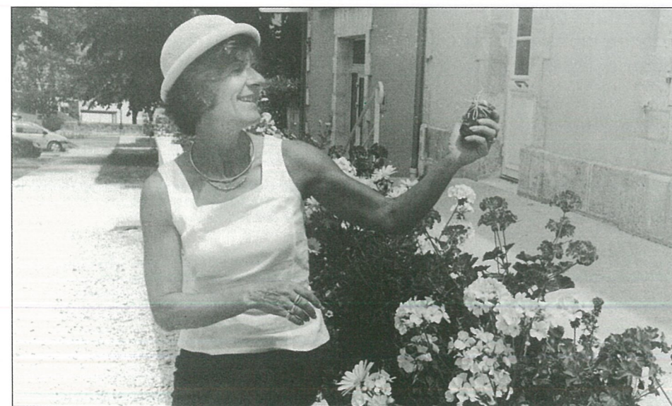
« Elle a du pot Madame le Maire, celui de gelée royale offert par Charente Nature »

Le Conseil Municipal, afin de pallier l'arrêt de travail d'un agent technique ainsi que les congés annuels d'été, décide d'embaucher un agent d'entretien en CDD du 6 juin au 31 août 2001.