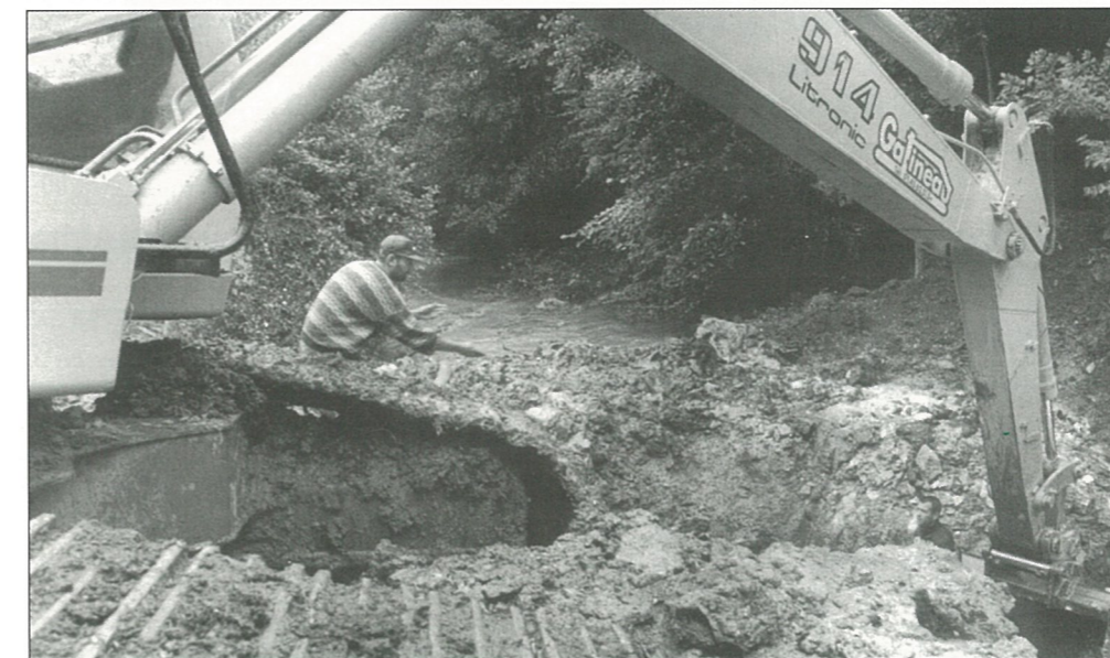
Travaux au Moulin du Duc