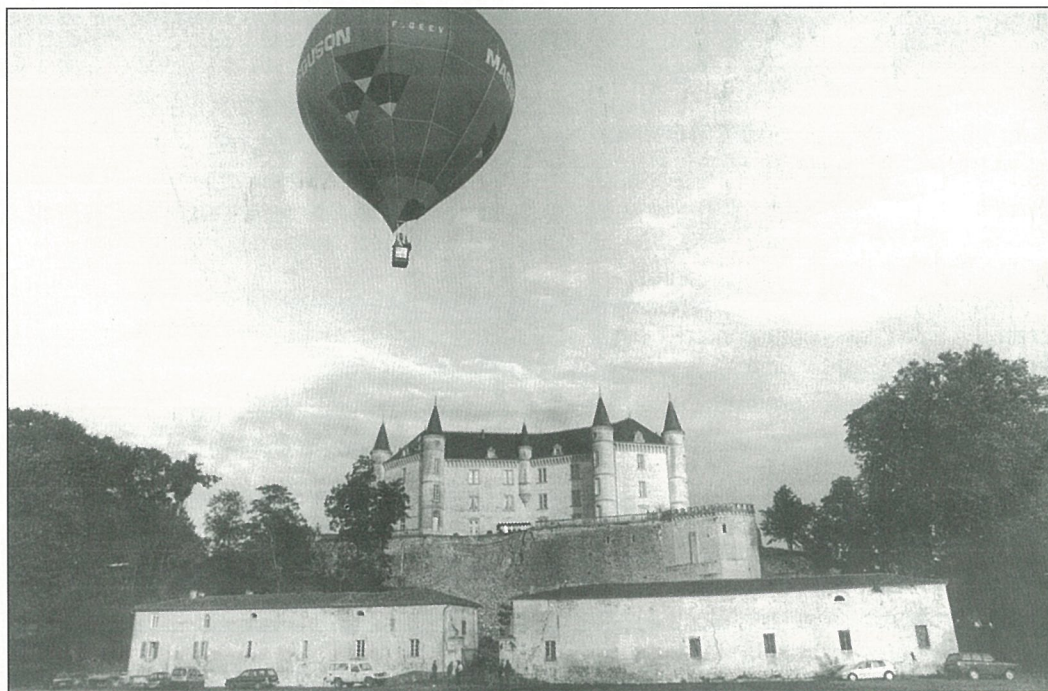
L'été, le bonheur de s'envoyer en l'air...