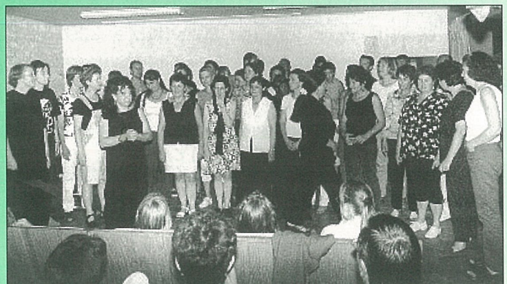
Courant d'air et Calypso, des chœurs à prendre...dans les oreilles..