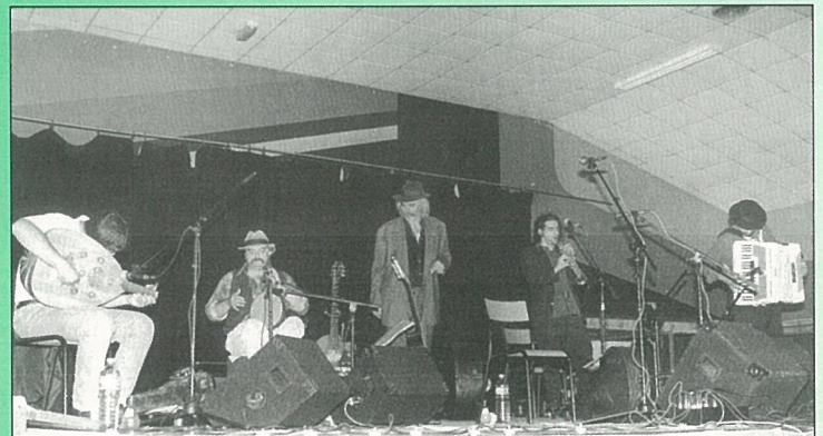
"ZHAR", vous avez dit ZHAR ; comme c'était beau !