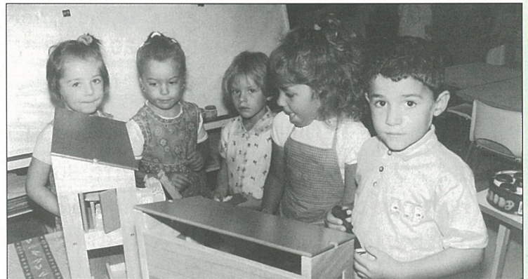
La rentrée en maternelle c'est : "prépare ton bac... à sable !