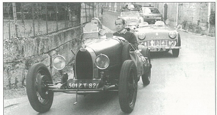
Au rallye du circuit des remparts t'as que des tacots !