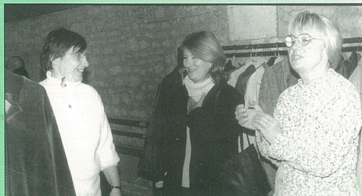
Lors de la braderie du Secours Populaire on donne aussi de la bonne humeur