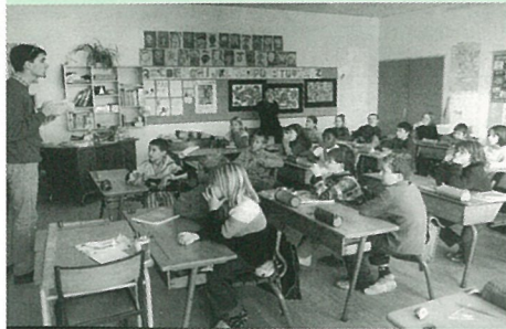
Initiation à l'euro à l'école : un franc succès