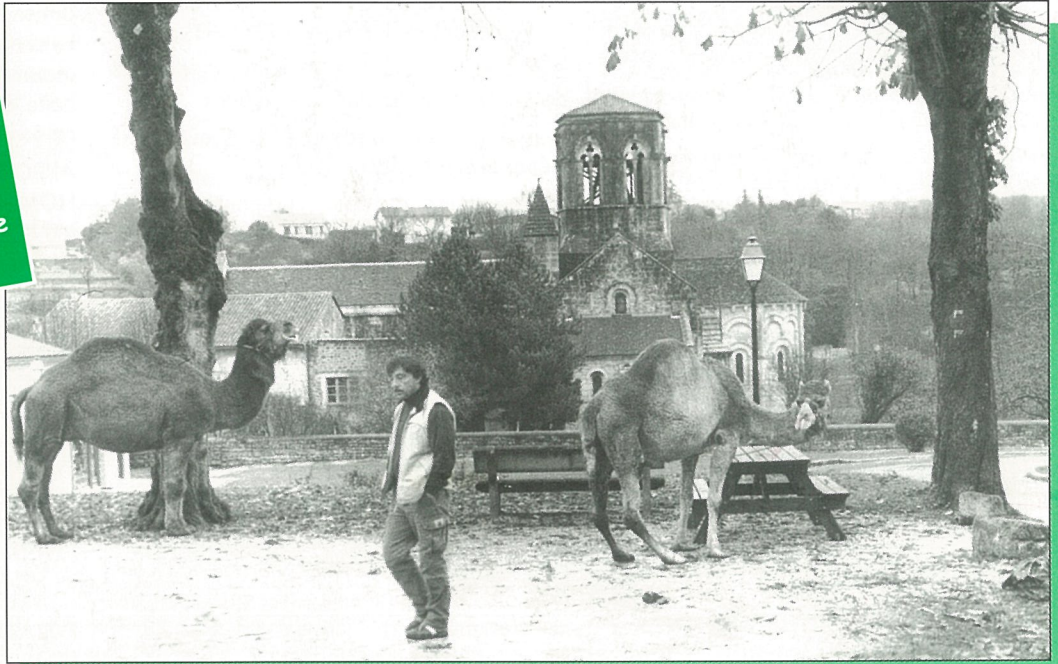
Finies les fêtes, il faut se remettre à bosser..!