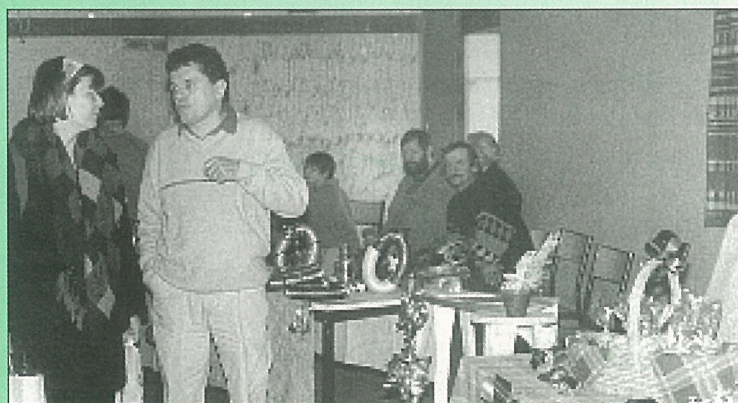
Buena fiesta atelier social club !