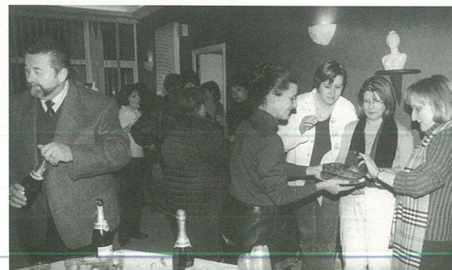
Cérémonie pétillante pour les vœux du Maire et du Conseil aux employés municipaux

Le Conseil Municipal décide d'instaurer le régime de la participation pour le financement de voies nouvelles et des réseaux définie aux articles L.332-11-1 et L.332-11-2 du Code de l'Urbanisme, pour les propriétaires riverains de telles voies, situés dans un rayon de moins de 80 mètres.