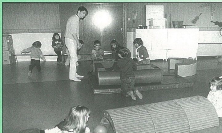
Des jeux, j'en veux...

VENDREDI 15 A. G. DONNEURS DE SANG À ÉTRIAC