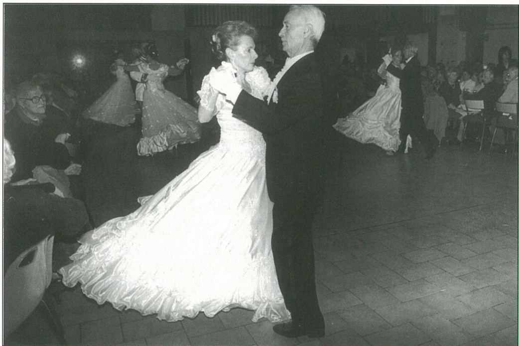
Quand les valseurs de Vienne...monastériens!