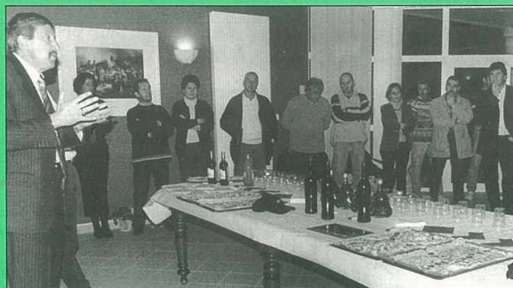
Le foot, une équipe de partenaires accueillis à la mairie