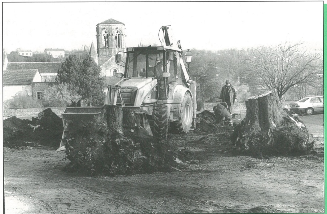
Des arbres nouveaux remplaceront bientôt les arbres malades