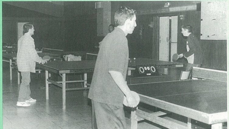
Scène et set de ping-pong dans la salle polyvalente