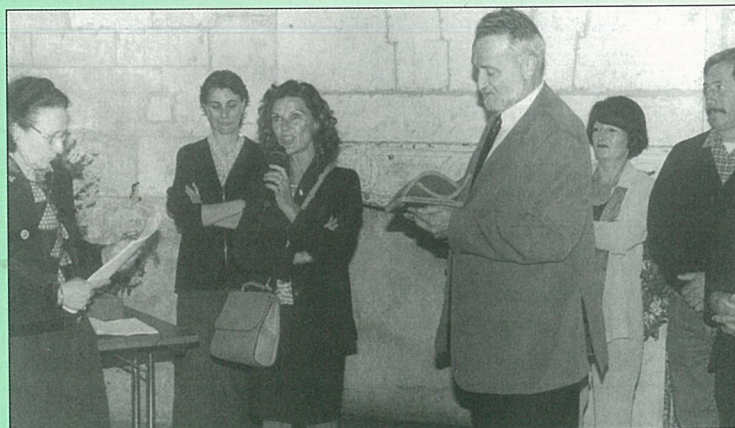
Une " tuile " pour le four du petit Guillon, pour régler l'ardoise de sa rénovation