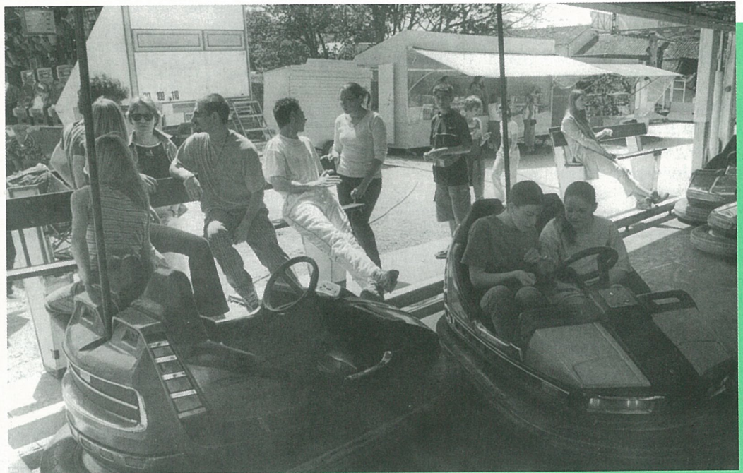
A la frairie du Comité des Fêtes, les coups, on s'en tamponne !