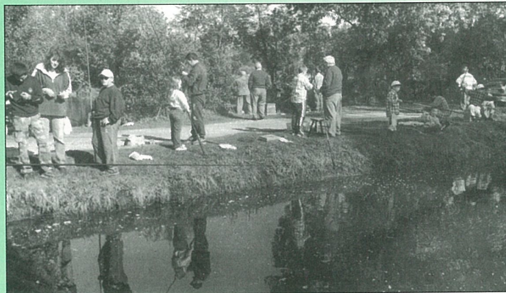
Coups de gaules... au concours de Pêche