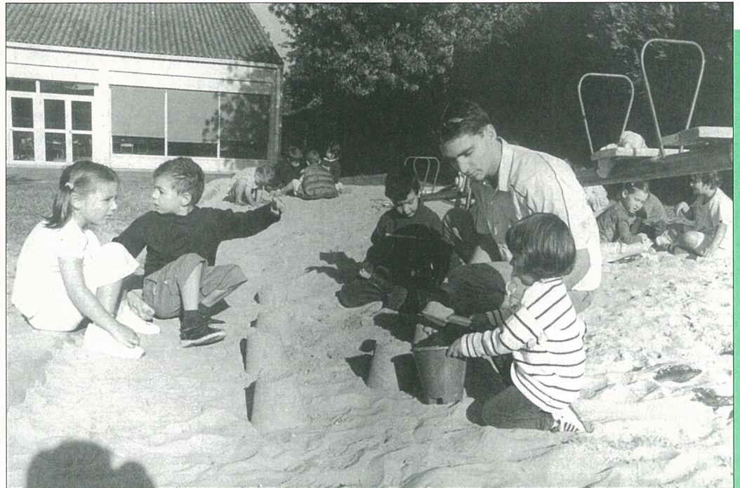
Rentrées à la pelle en septembre..!