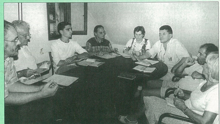
Rangs très fournis pour le bureau de la M.J.C