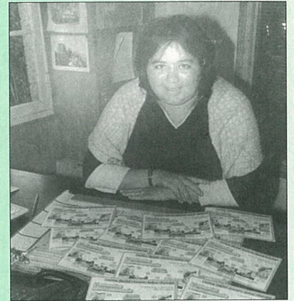
Rentrée mise en page au centre social