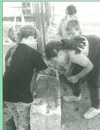
Rentrée à la truelle au centre de loisirs.

Pour les enfant un jeu de piste à découvrir