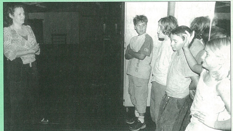
Rentrée mise en scène pour l'atelier théâtre