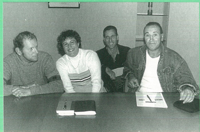
Fêtes comme vous aimez avec un nouveau bureau du comité. (Photo Alain PORTE).