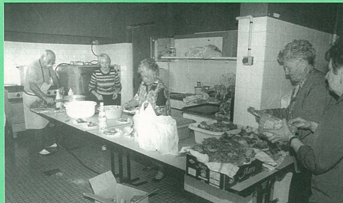
Le repas du cercle des aînés, côté cuisine (Photo Alain PORTE).