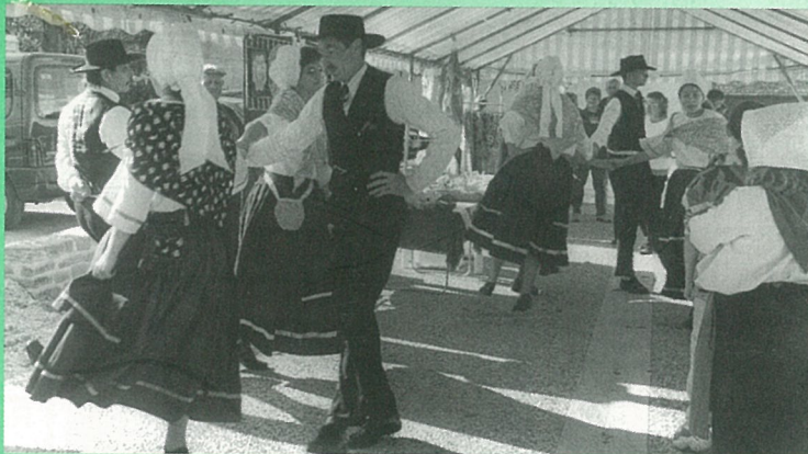
Les Rabalbots de Fléac pour clôturer une animation commerciale réussie