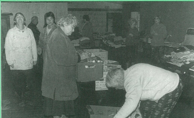
Le secours est toujours aussi populaire.