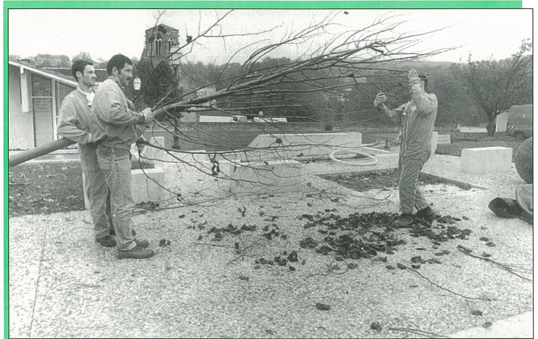
Le champ de foire est redevenu un lieu branché ..! (Photo Alain PORTE).