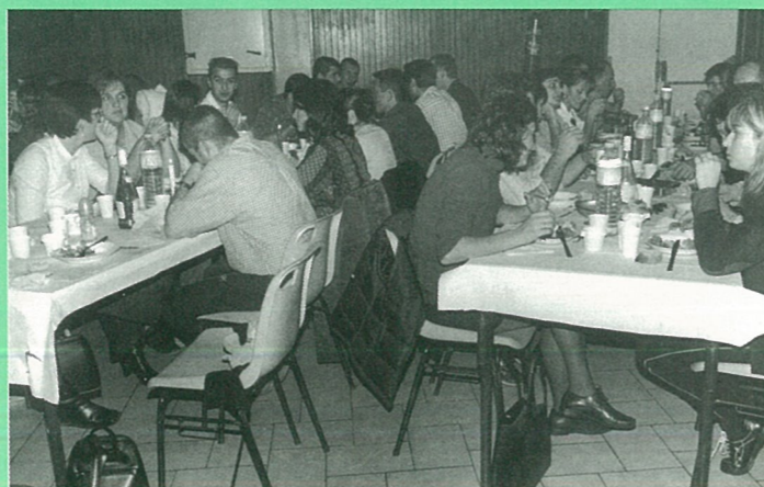
Qui n'est pas là pour la paëlla du SCM ?