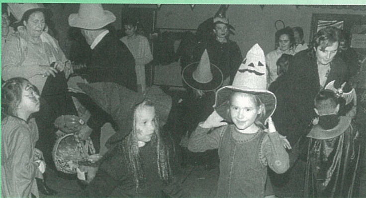
Halloween, c'est pas sorcier pour se déguiser...