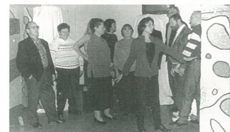
Le théâtre de l'atelier