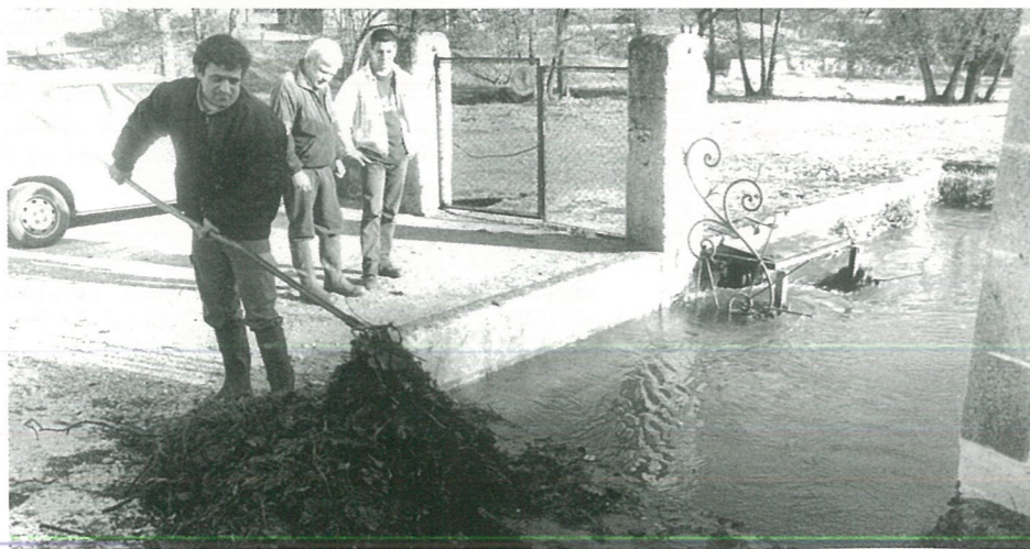
Nettoyage d'hiver (Photo Alain PORTE).

Une convention sera passée entre la Commune et la Communauté de Commune pour le transfert de ces biens.