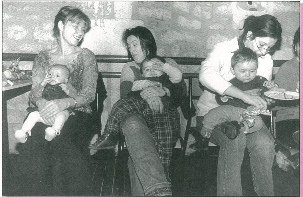
“ Pour 2003, allez les petits...! “.