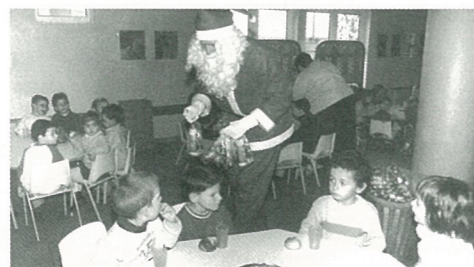
Le père Noël a fait son devoir à l'école maternelle