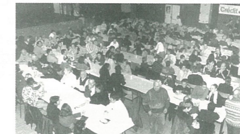
Pour le TÉLÉTHON, les monastériens ...