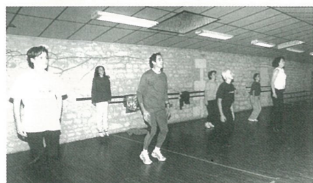
"La gym, j'y mets... après les fêtes !"