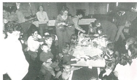
"La crèche avant Noël".