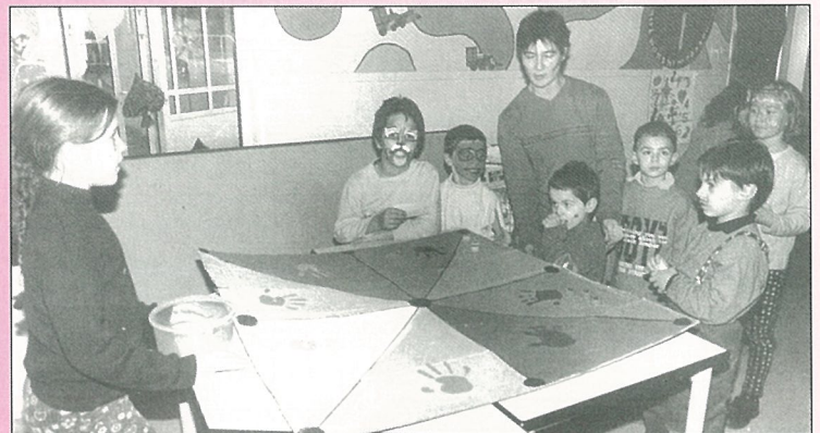
Le grand jeu du casino au centre de loisirs