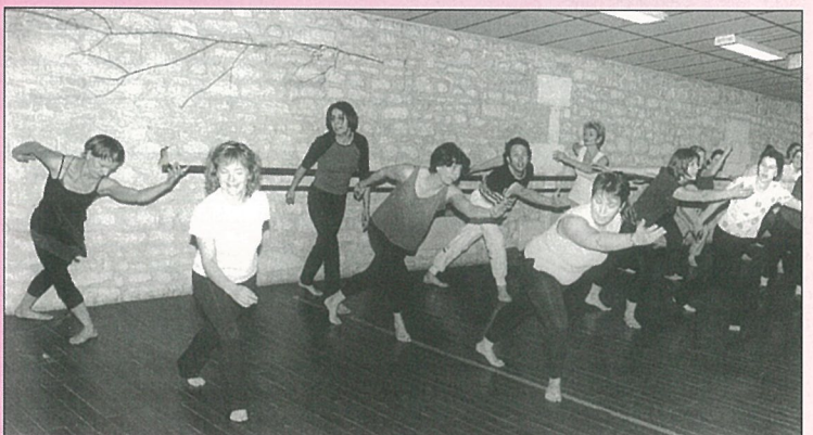
La M.J.C. noire de monde pour la danse africaine