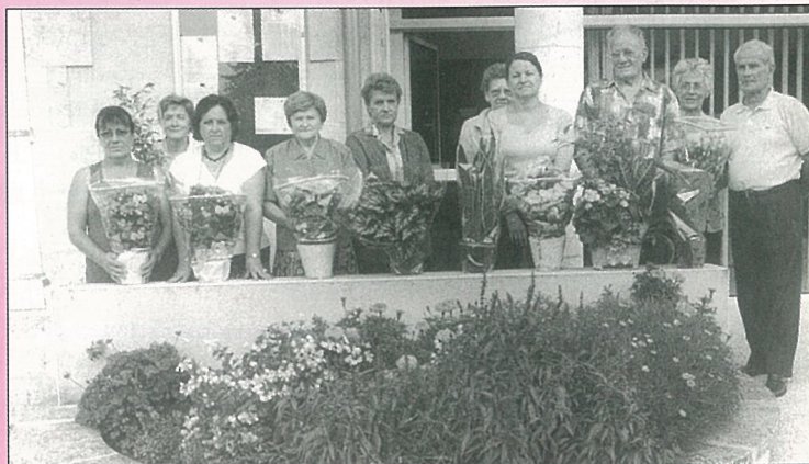
Lauréats des maison fleuries : leurs plantes ont du pot !

RENSEIGNEMENTS Mme Anne-Marie MARTIGNAC ☎ 05 45 67 84 88