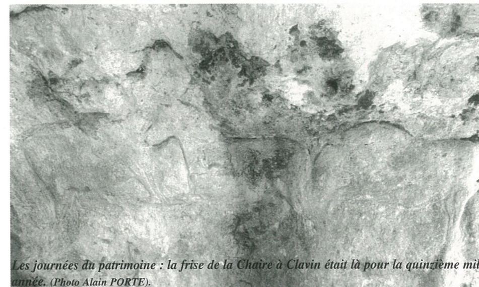
Les journées du patrimoine : la frise de la Chaire à Clavin était là pour la quinzième mille année.

La Boucle Locale radio, une autre technique aurait pu être utilisée mais les opérateurs investissent peu dans nos zones rurales. Celle-ci permet à partir d'une liaison hertzienne à très haute fréquence et, via une antenne relais, de desservir des points équipés d'une simple antenne, dans un rayon de 4 à 10 km selon la fréquence retenue.