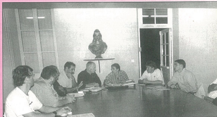
Les artisans et les commerçants préparent les Automnales