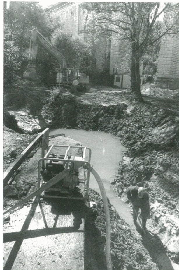
Sous le viaduc des Couteaubières (Photo Alain PORTE).

En application de la loi SRU, le Conseil Municipal décide de prendre en charge les frais d'extension de réseau électrique pour la somme de 761,40 euros.