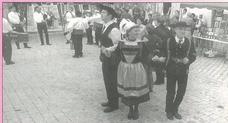
Le temps (!) des Bretons pendant les Automnales