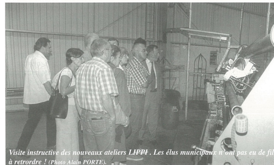
Visite instructive des nouveaux ateliers LIPPI. Les élus municipaux n'ont pas eu de fil à retrordre !

- toutes personnes ayant droit à une sépulture de famille alors même qu'elle n'est pas domiciliée dans la commune.