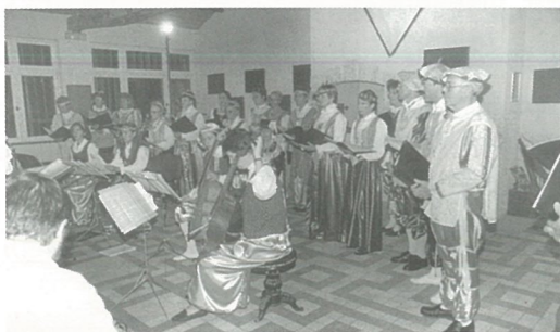
la Chorale CANTABILE à Mouthiers

dimanche 23 NOVEMBRE à 15 heures. Renseignements : 05.45.67.92.95