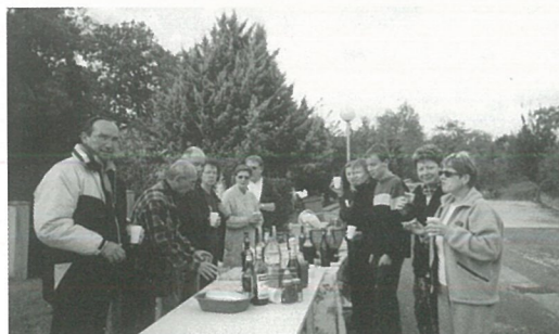
Apéro du lotissement de La Croix Guillaud