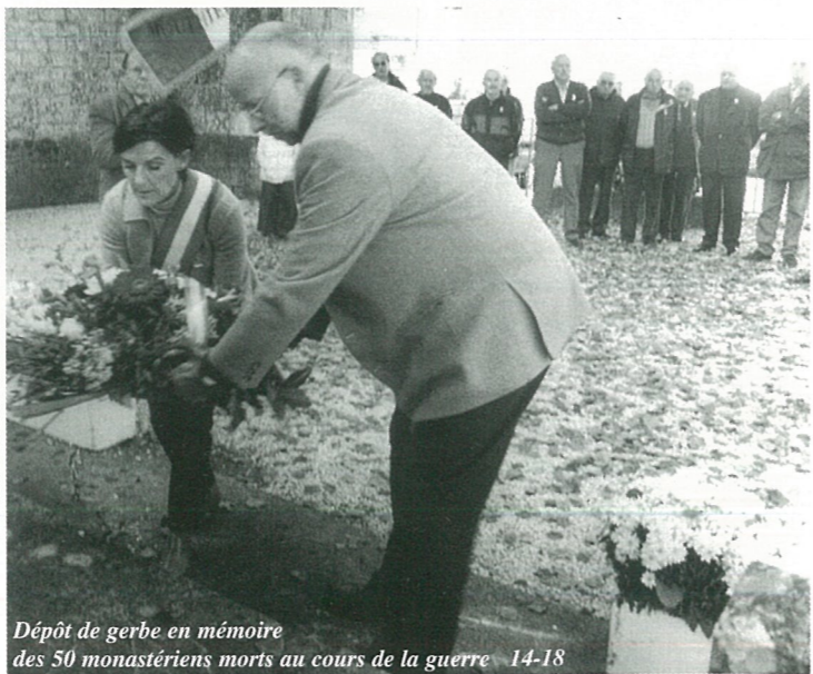
Dépôt de gerbe en mémoire des 50 monastériens morts au cours de la guerre 14-18

Le marquage au sol délimitant les emplacements de stationnement dans la rue de la Boème sera repeint. Des emplacements de stationnement seront matérialiser par peinture au sol sur la place Petite-Rosselle.