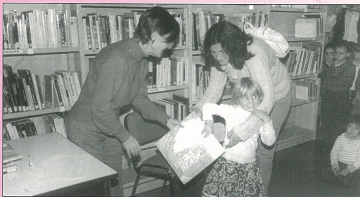
La lecture n'attend pas le nombre des années