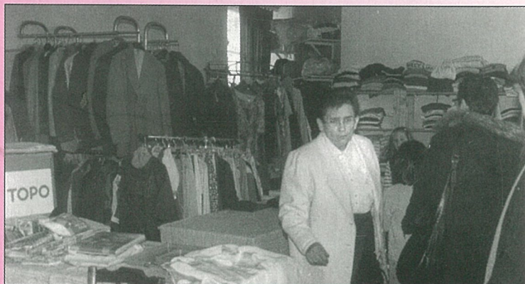
La solidarité n'est pas bradée au secours populaire. Les vêtements si !