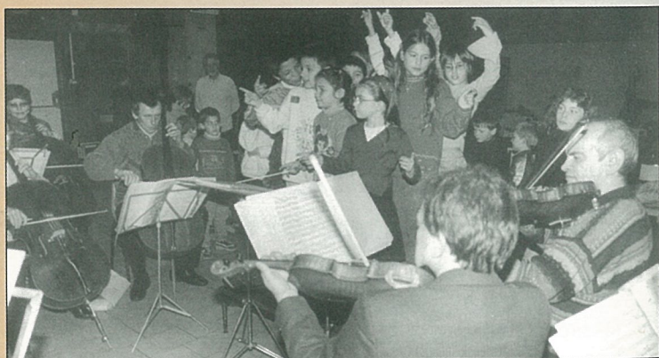
L'orchestre russe accueilli par les écoliers