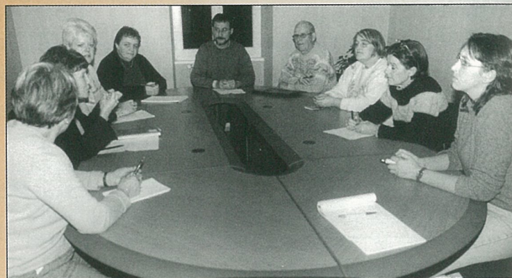
La solidarité à l'heure intercommunale