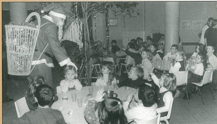
Le père Noël du Comité des fêtes de passage à la maternelle