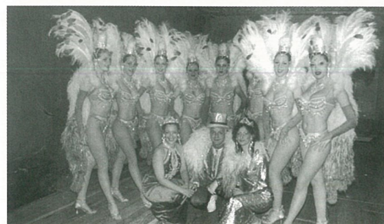
Grand'folie pour le SCM

Passion pour le patrimoine avec l'association Boème Patrimoine