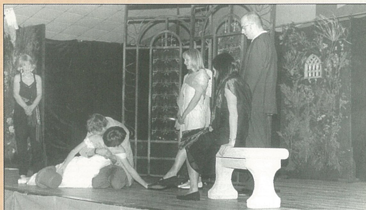
Le plaisir offert pour une soirée par Arsénique Théâtre