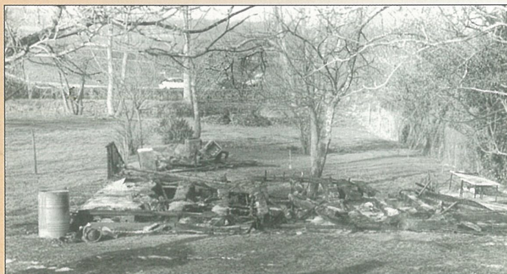
La tristesse et l'incompréhension après l'incendie d'un cabanon au Grand Guillon