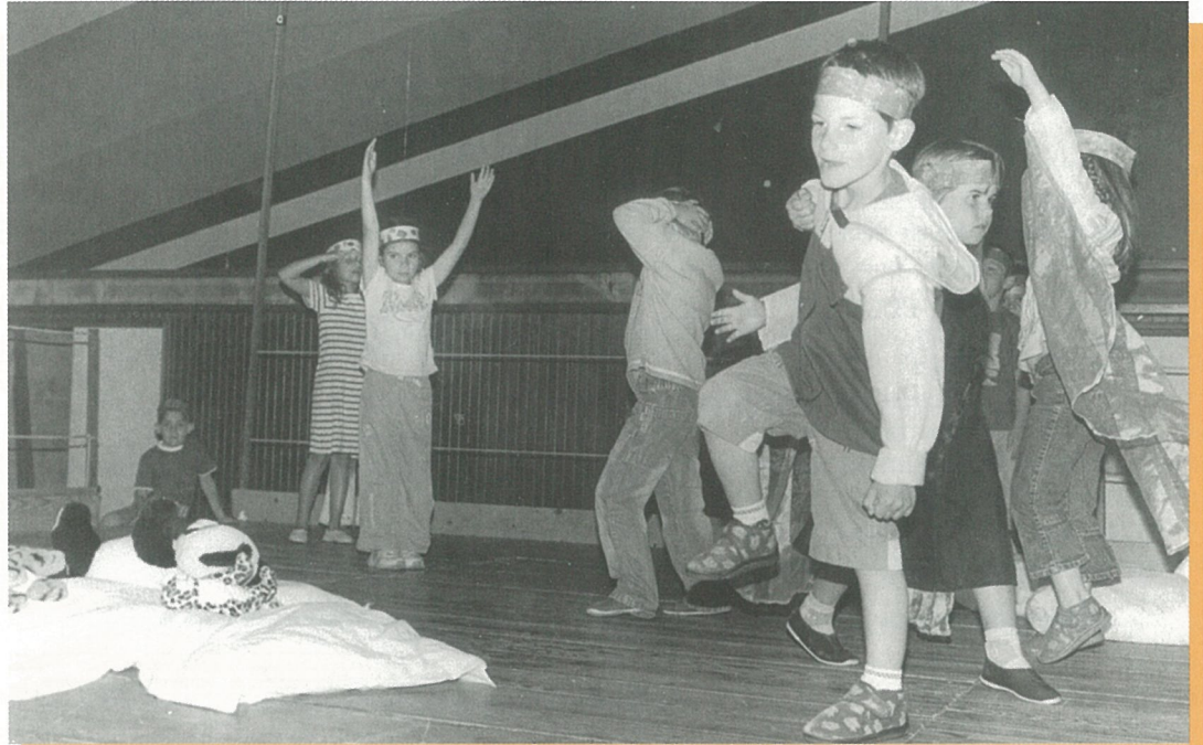
Spectacle de la maternelle. Bonne vacances les petits !